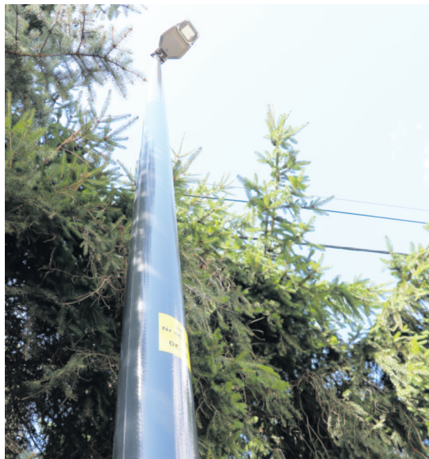
Nowe energooszczędne lampy

Systematycznie poprawiamy bezpieczeństwo. Na terenie gminy powstało 411 energooszczędnych lamp: • w Janowie • w Smardzewie ul. Zagajnikowa • w Łagiewnikach Nowych ul. Maków Polnych • w Jedliczu A ul. Księdza Brzóska • w Jedliczu B ul. Letniskowa • w Dębniaku ul. Malinowa • w Ustroniu ul. Pływacka przy ul. Ustronie • budowa oświetlenia wzdłuż dróg gminnych relacji Bądków-Kotowice, Biała – Cyprianów, Bądków – Warszycy.