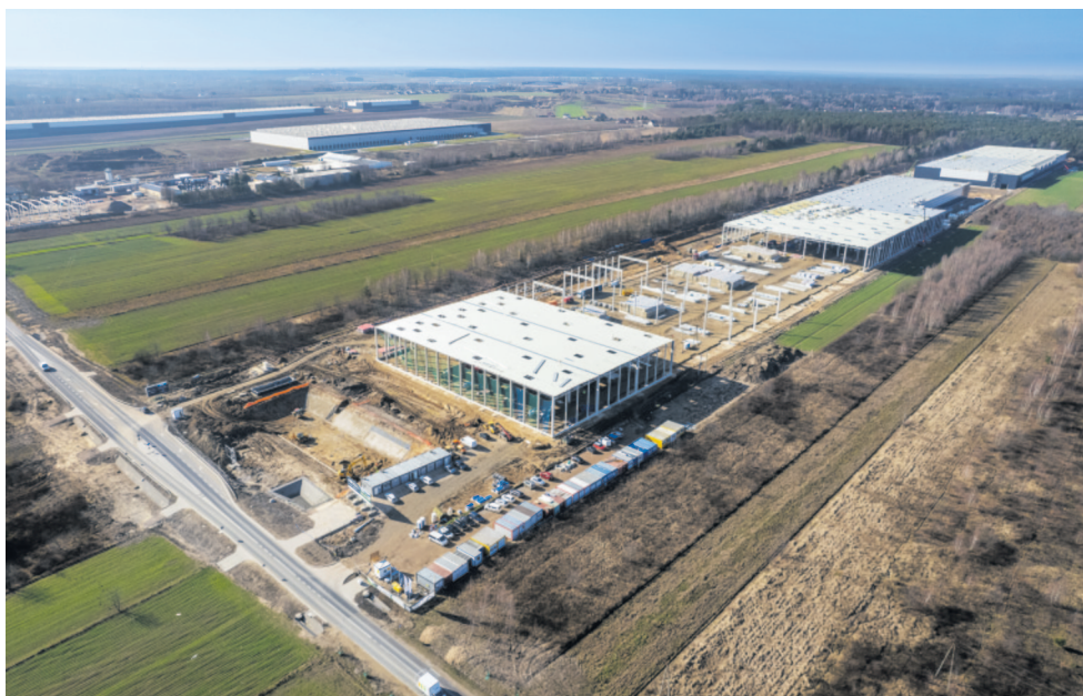
Rozrasta się strefa przemysłowa w Dąbrówce Wielkiej

- Tereny inwestycyjne, które od 18 lat są uwzględnione w planie zagospodarowania przestrzennego Gminy Zgierz, dodatkowo położone blisko węzła komuni-