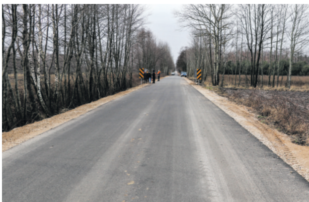
ul. Romanowska w Kęblinach

W budżecie inwestycyjnym na 2024 r. zaplanowano ponad 54 proc. środków na budowę kolejnych dróg: • w Giecznie ul. Podleśna • w Bądkowie • drogi gminnej relacji Dąbrówka Strumiany - Jeżewo • w Białej i Woli Branickiej • w Jedliczu B ul. Podleśna • w Giecznie ul. Łubinowa • w Giecznie ul. Podrzeczna • ul. Szkolna w Słowiku • oraz kontynuacja zadania rozpoczętego w 2023 r. - budowy drogi w Kolonii Głowie.