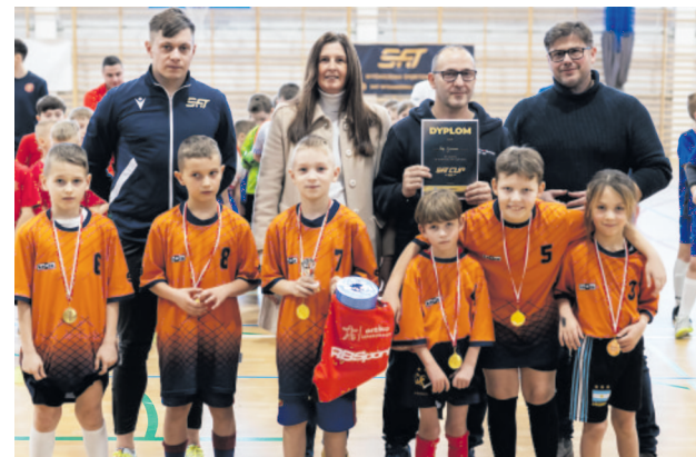
Drużyna ze szkoły w Giecznie