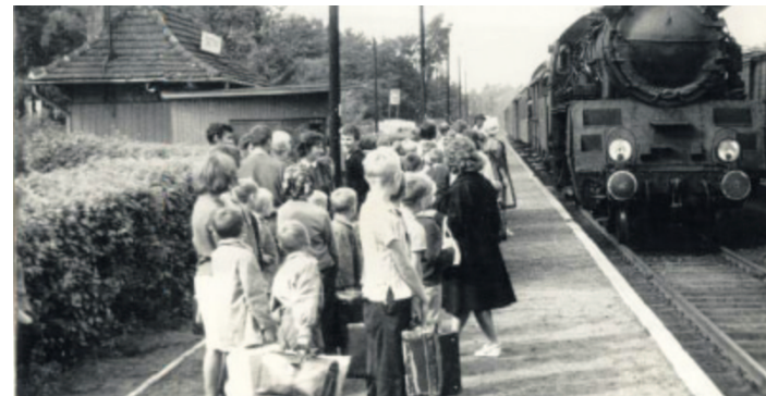
Wjazd pociągu na stację w Grotnikach