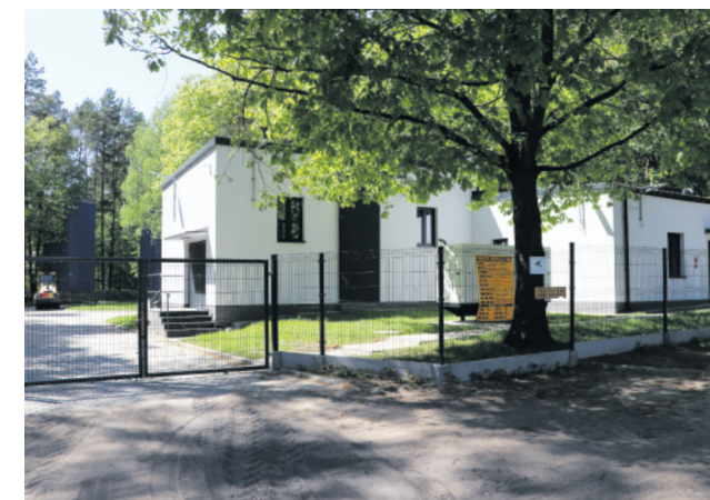
Zmodernizowana stacja uzdatniania wody w Ustroniu

Przed nami, w 2024 r. budowa sieci wodociągowych w Dąbrówce Wielkiej, Dąbrówce Strumiany, Dąbrówce Marianne, Giecznie, Grotnikach oraz rozbudowa kanalizacji sanitarnej w miejscowości Lućmierz i Rosanów.