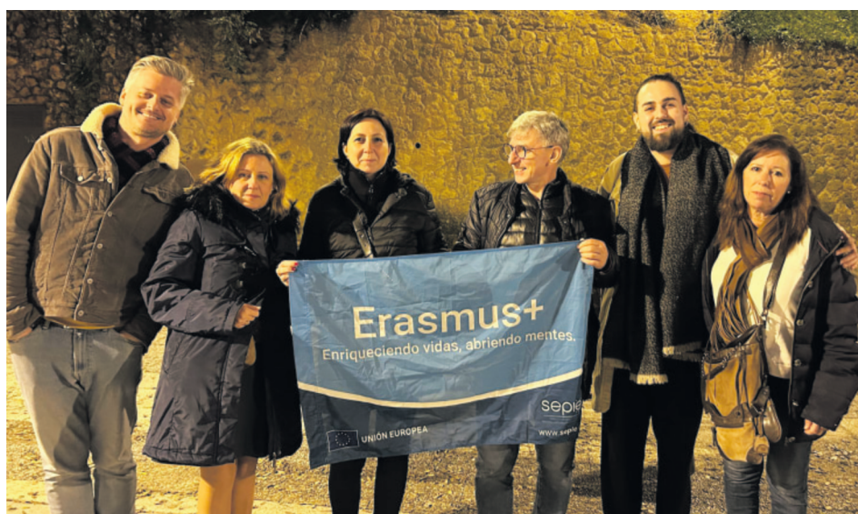
Wyjazd nauczycieli w ramach Erasmusu pozwolił na wymianę doświadczeń z pedagogami z Hiszpanii

W szczególny sposób nastawieni byliśmy na poznanie metody CLIL - czyli zintegrowanego kształcenia przedmiotowo-językowego. Dlatego nauczyciele brali udział w zajęciach dydaktycznych i obserwowali pracę swoich kolegów i