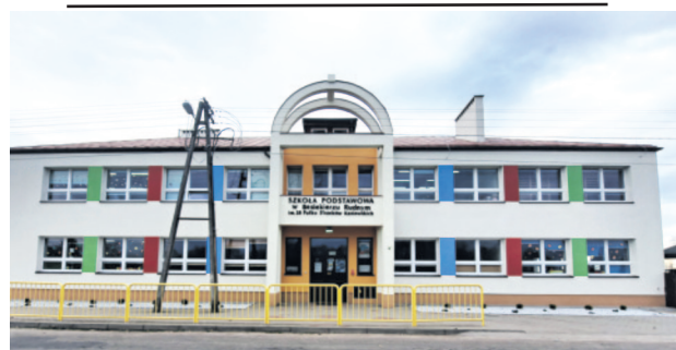
Szkola w Besiekierzu Rudnym - jeden z wyremontowanych budynków

Tylko w tym roku, kolejne oświetlenia będą montowane na drogach: od Swobody do Swobody Małej, w Palestynie, w Emilii, Rosanowie, Ustroniu, Skotnikach.