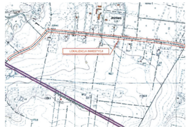
Lokalizacja inwestycji - Dąbrówka Strumiany - Jeżewo

Przebudowa drogi w miejscowości Biała i Wola Branicka na odcinku od drogi wojewódzkiej Nr 702 do drogi gminnej Nr 120360E. Został rozpisany przetarg, wykonawca zostanie wyłoniony na początku marca. Wartość inwestycji 3.100.000,00 zł.