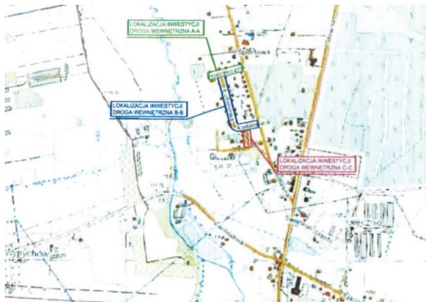
Lokalizacja inwestycji w Giecznie, ulice Łubinowa i Poprzeczna

19 lutego podpisana została umowa na przebu-