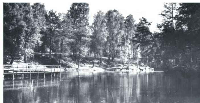
Grotniki - kąpielisko na rzece Lindzie