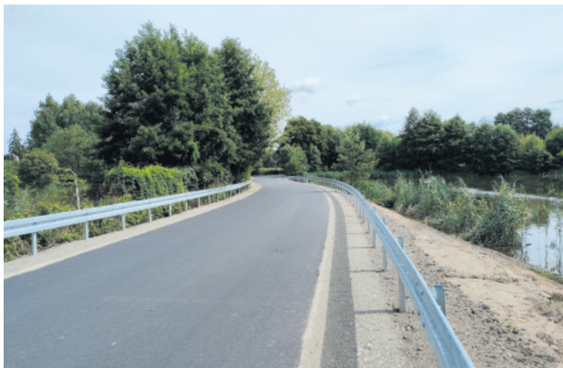
ul. Zgierska w Szczawinie

Z perspektywy mieszkańców istotne są inwestycje drogowe. Mamy ponad 300 km dróg, które systematycznie modernizujemy.