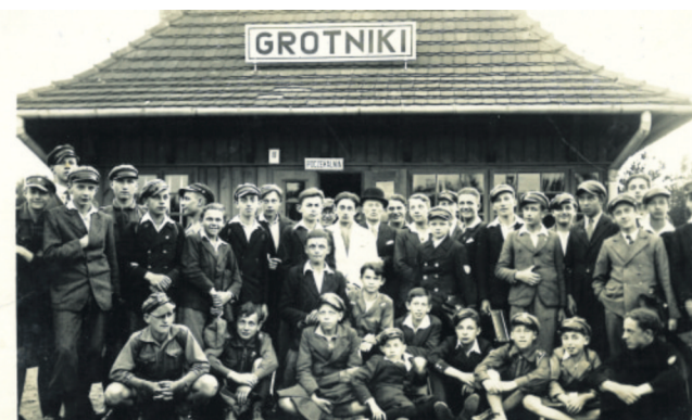
Wycieczka - grupa uczniów na stacji kolejowej w Grotnikach, 1934r.