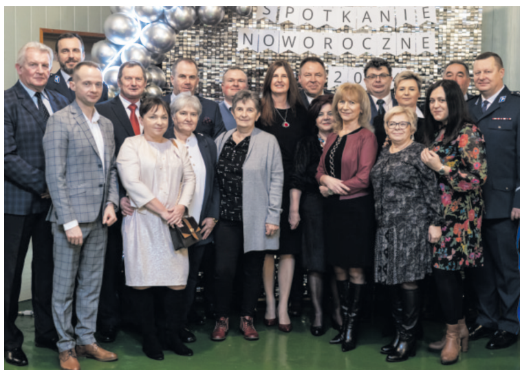
Podczas spotkania noworocznego

Wręczając statuetki wyróżnionym mieszkańcom Wójt powiedziała między innymi - wszyscy