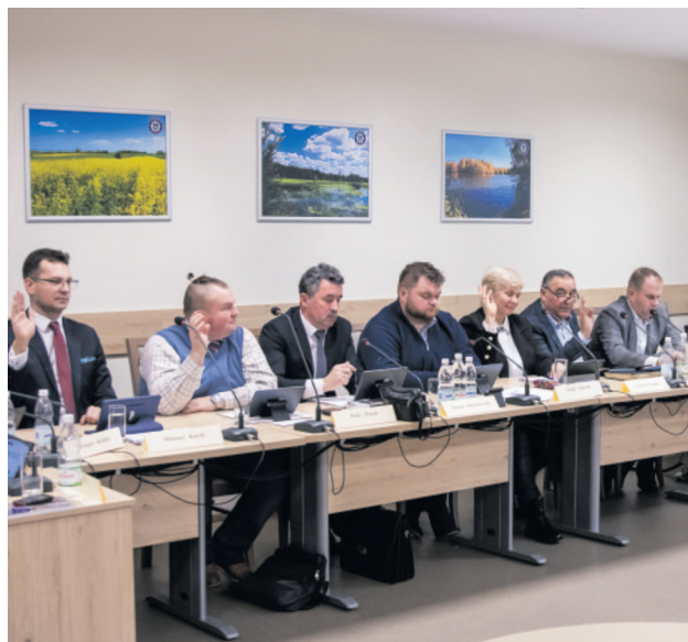
Radni Rady Gminy zagłosowali za budżetem na 2024 r.

Budżet na 2024 r. jest, jak do tej pory, największym budżetem pod względem inwestycji, co stawia przed wszystkimi ogromne wyzwania, ale również stwarza ogromne szanse dla gminy. Mamy w planach duże inwestycje, które pozwolą na jeszcze bardziej dynamiczny rozwój. Jest to budżet odważny, ale jak najbardziej możliwy do zrealizowania. Poprzednie lata pokazały, że podejmo-