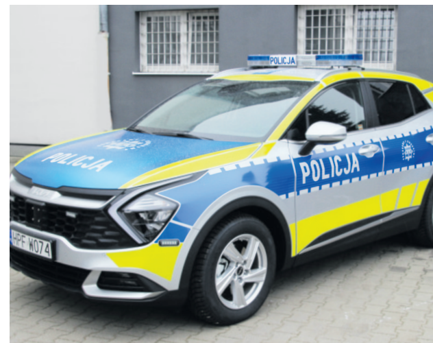
Samorządowcy przekazali nowy samochód dla Policji

Nowy samochód został zakupiony dzięki finansowemu wsparciu samorządów: powiatu zgierskiego, miasta Zgierza i gminy Zgierz. Uroczyste poświęcenie i przekazanie samochodu odbyło się na placu Komendy Powiatowej