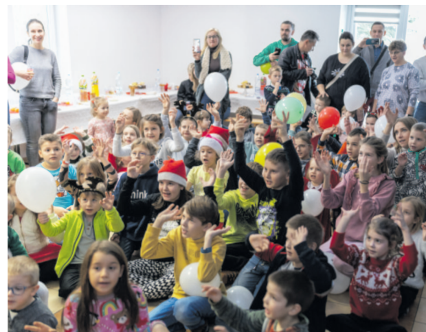
Tu jesteśmy Mikołaju

Na wszystkich czekały pyszności przygotowane przez Panię z KGW Jedlicze A i B. Gdy zabawa wraz z elfią animatorką dobiegała końca z zewnątrz dobiegł dźwięk dzwonów Świętego Mikołaja, który przybył