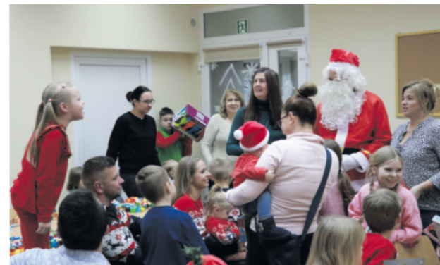
- Ile reniferów ma Mikołaj?

wali się przygotowanym poczęstunkiem i słuchali świątecznych melodii. [PN]