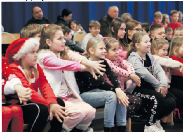
Już nie możemy się doczekać

Magiczne sztuczki prezentowane przez iluzjonistę wzbudziły niemały zachwyt wśród zgromadzonych gości.