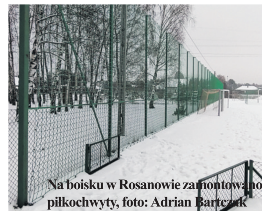
Na boisku w Rosanowie zamontowano piłkochwyty, foto: Adrian Bartczak