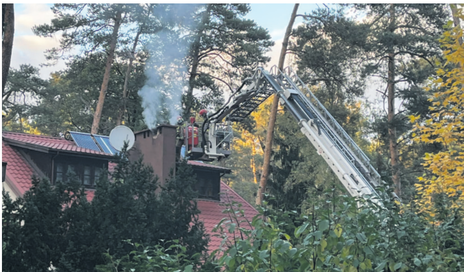
Zalegająca w kominie sadza o grubości zaledwie kilku milimetrów już może stać się przyczyną pojawienia się pożaru