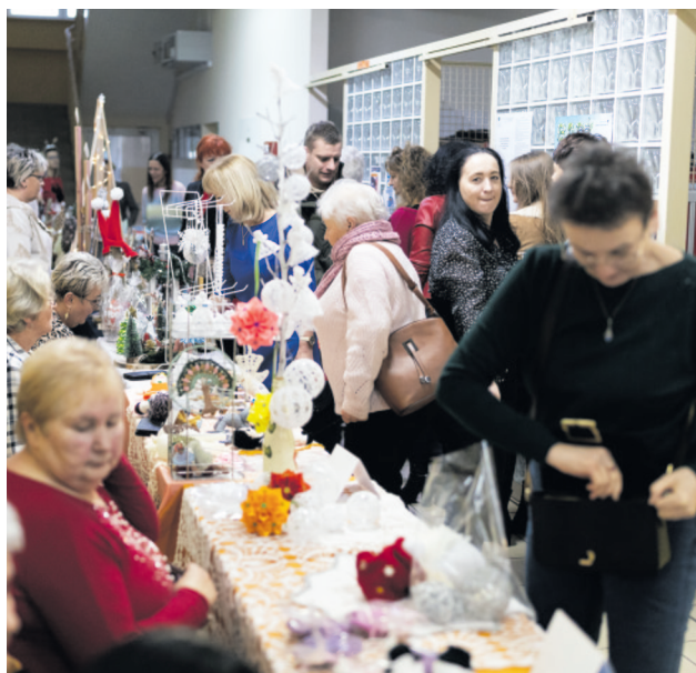
Niepowtarzalne prezenty można było kupić na świątecznym kiermaszu