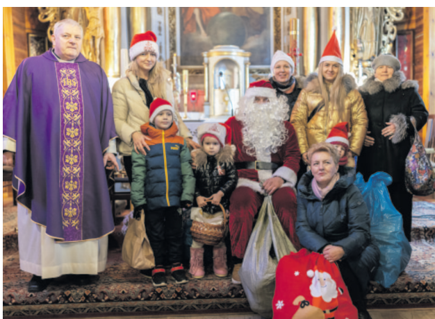
Święty z Ekipą w kościele w Białej