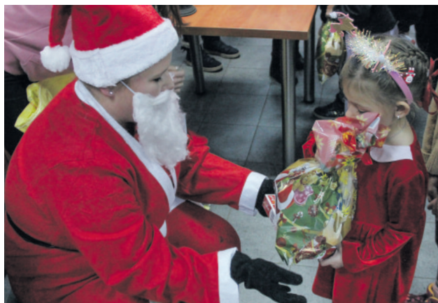
Mamy podobne ubranka

świętecznych ozdób, które dzieci zabrały do domu. Najmłodszy szczególnie radośnie reagowali na występ z pokazem sztuk magicznych.