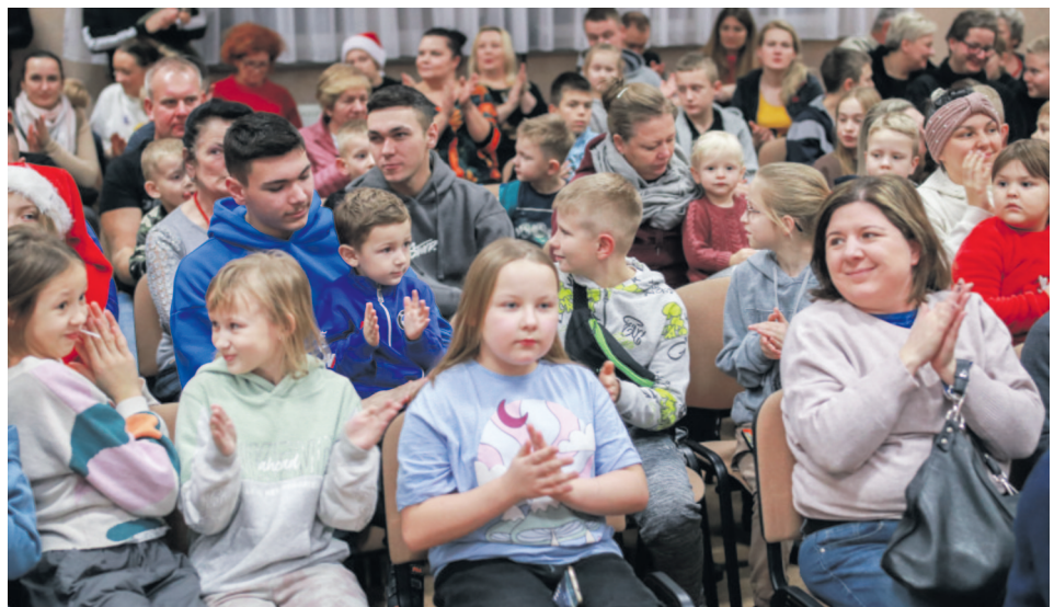
Na spotkaniu mikołajkowym w sali OSP w Kaniej Górze