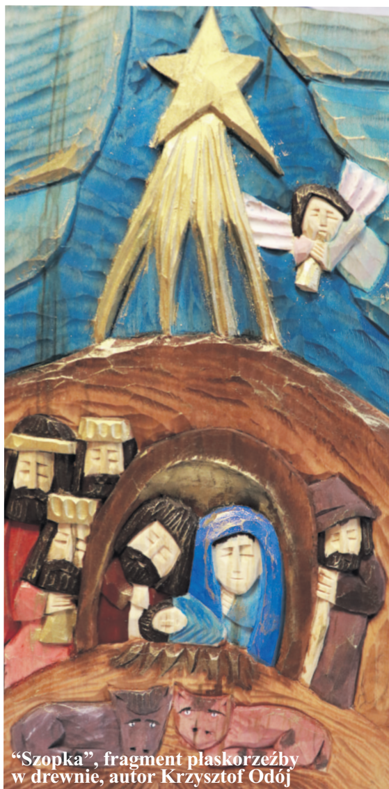
“Szopka”, fragment płaskorzeźby w drewnie, autor Krzysztof Odój