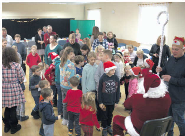
W ogonku do Świętego...każdy dostanie coś miłego