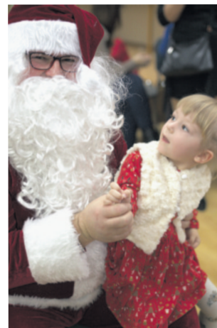
Czyli tak wygląda Mikołaj