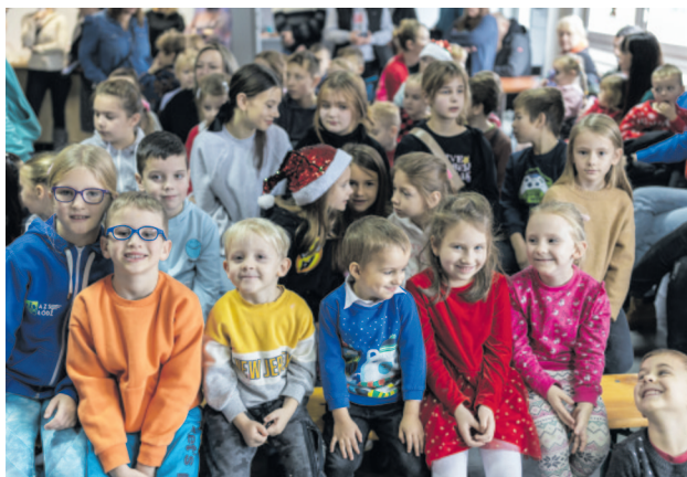
W oczekiwaniu na Mikołaja w świetlicy w Rosanowie

Wiele dzieci z rodzicami skorzystało z zaproszenia. Wspólnie spędzony czas minął szybko na malowaniu