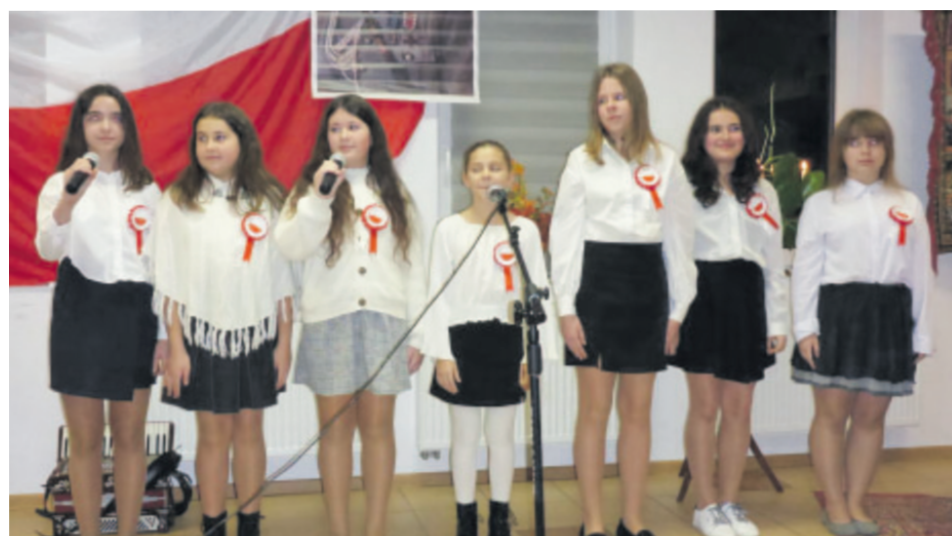
Chór Leśne Nutki z Zespołu Szkolno – Przedszkolnego w Grotnikach