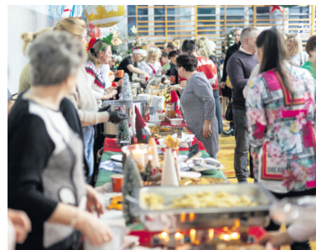
Świąteczny poczęstunek przyciągnął wielu smakoszy