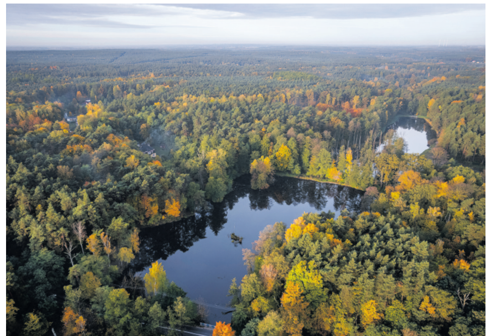
Grotniki, zbiornik nad Lindą

Z dużą determinacją strona społeczna zgłaszała uwagi do Planu. Znalazły się wśród nich takie postulaty jak: zaniechanie pozyskania drzew w dolinach rzek, mo-