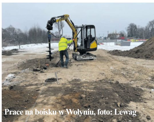
Prace na boisku w Wołyniu, foto: Lewag

W tym roku opracowany został projekt dla inwestycji pn. „Zabezpieczenie boiska w Giecznie” - koszt dokumentacji projektowej to 8.600,00 zł