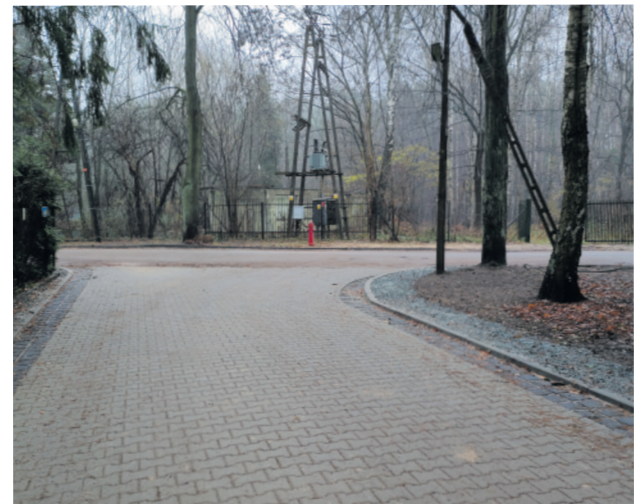
Nowa nawierzchnia na ul. Ogrodowej w Grotnikach