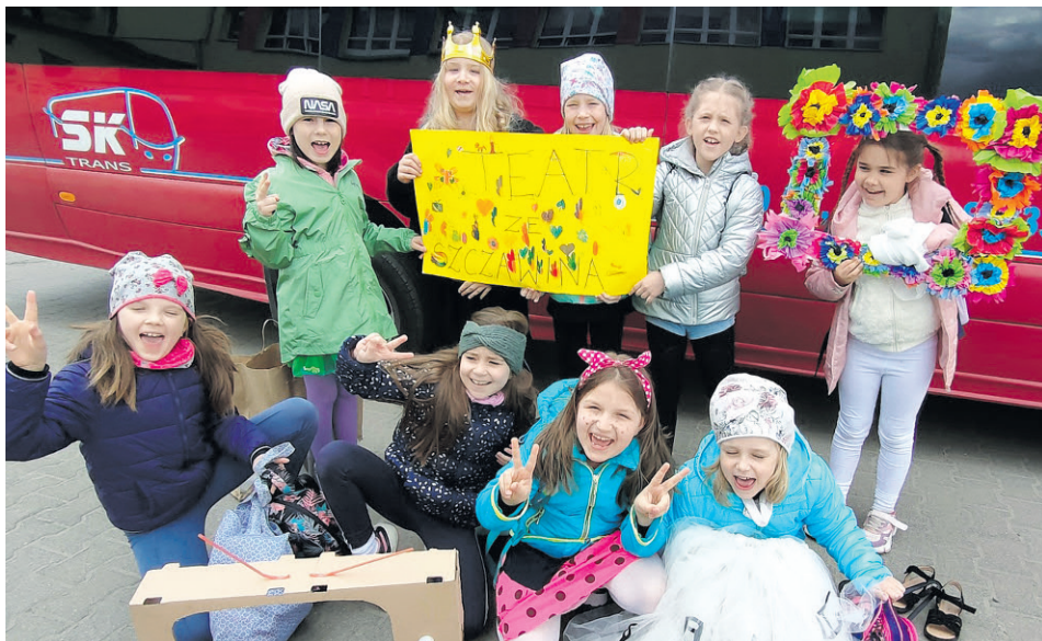
Młody zespół Teatru ze Szczawina z I nagrodą w XVIII Powiatowym Przeglądzie Małych Form Teatralnych Apli Papli

W dniu 27 kwietnia dzieci uczestniczące w warsztatach teatralnych w szkole w Szczawinie brały udział w XVIII Powiatowym Przeglądzie Małych Form Teatralnych APLI PAPLI „Życie to teatr”. Przegląd odbył się w Młodzieżowym Domu Kultury im. Małego Księcia w Ozorkowie.