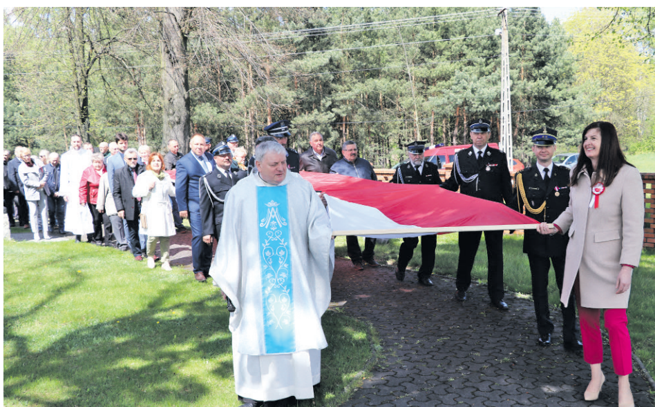
W wyjątkowy sposób zmanifestowano przywiązanie do symbolu narodowego - flagi, którą wspólnie nieśli mieszkańcy i zaproszeni goście

- Twórcy Konstytucji chcieli ugruntować wolność i obronę niepodległość. Wówczas był to dowód, że Rzeczpospolita jest krajem pełnym sił, który stał się prekursorem przełomowych zmian odpowiadających duchowi czasu. (...) Dokument stał się kamieniem węgielnym dla naszej wolności i państwowości. Dzisiaj szczególnie myślimy o naszym wielkim obowiązku budowania bezpiecznej i silnej Polski, niepodległego Państwa i szczęśliwego Narodu! Polska, wstępując do Unii Europejskiej i NATO stała się częścią sojuszy, które dają nam poczucie bezpieczeństwa i gwarancję nienaruszalności granic, nie do przecenienia, kiedy widzimy, jak o swoje państwo