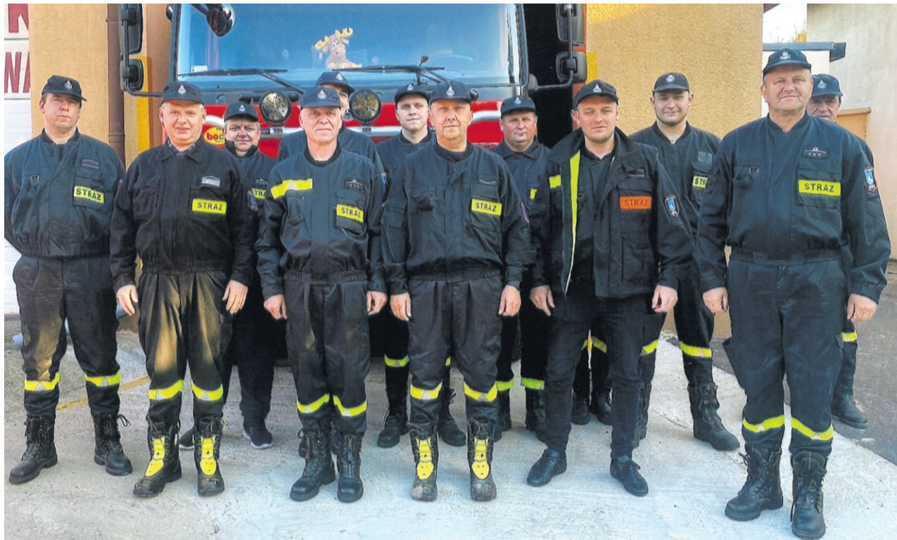
Drużyna OSP Skotniki.

- Udzielamy się podczas świąt państwowych i ko-