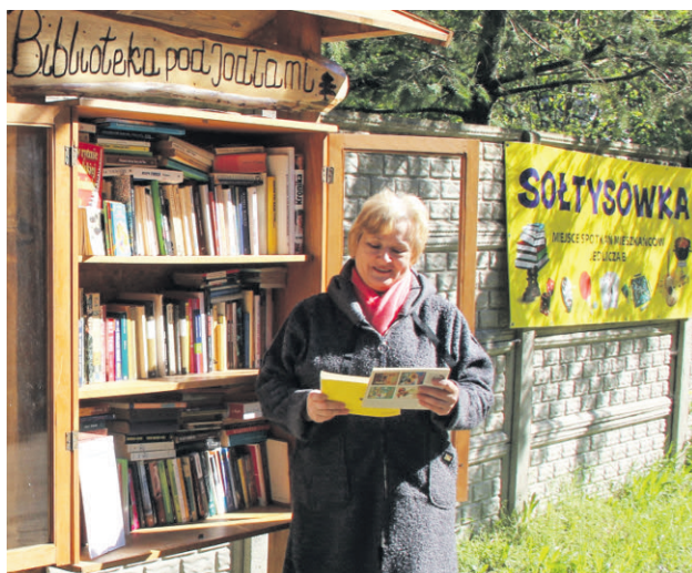
Biblioteka na świeżym powietrzu w Jedliczu B

- Przed wszystkim chciałam otworzyć sołtysówkę dla chętnych Mieszkańców Trójwsi. Mamy w niej wiele książek, podarowanych przez Mieszkańców, pomyślałam, że warto wynieść je do ludzi. Spodobał mi się pomysł biblioteki na świeżym powietrzu przy GCKSTiR w Dzierżąnej. Pracownicy Gminnego Centrum Kultury, Sportu, Turystyki i Rekreacji w Dzierżąnej wykonali witrynę na książki również dla nas, pomogli ją także zamontować na miejscu. I tak książki wyszły na ulicę przy