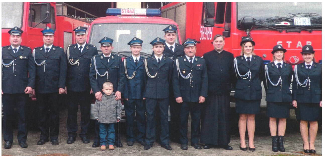
Drużyna OSP Ustronie-Grotniki, 2014 r.

glądają się pracy starszych, biorą udział w konkursach pożarniczych i w zawodach strażackich.