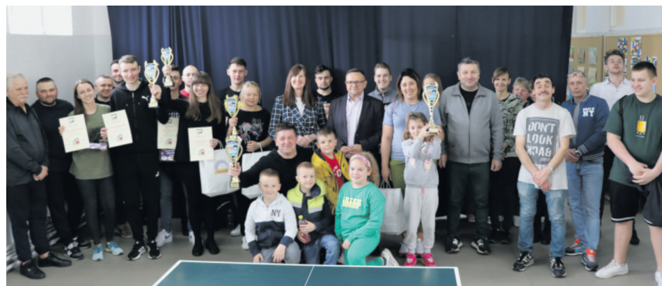
Uczestnicy I Amatorskiego Turnieju Tenisa Stołowego "Biała Open +16"