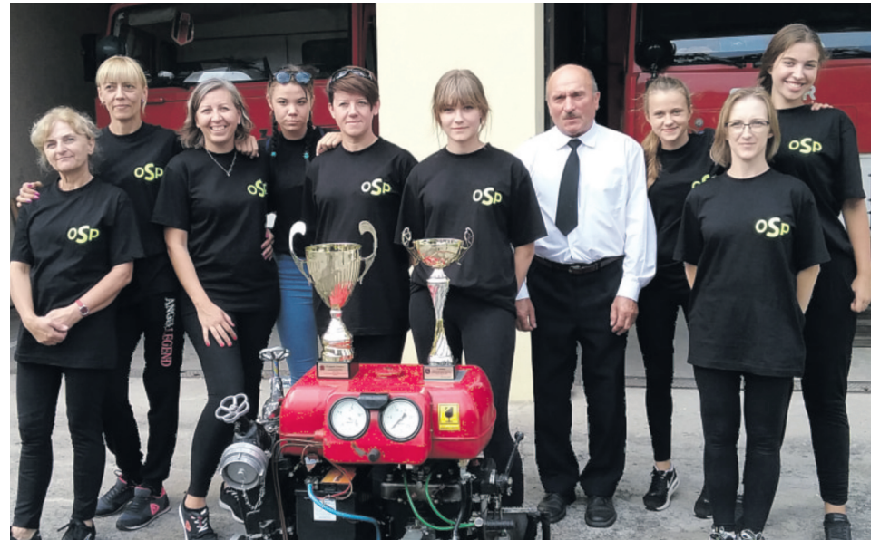
Jedyna w Gminie Zgierz Kobięca Drużyna Pożarnicza OSP Ustronie-Grotniki

Młodzieżową Drużynę Pożarniczą. Od 2002 roku w ramach jednostki działa młodzież, zarówno chłopcy jak i dziewczęta. Pod okiem starszych Druhów szkolą się z wiedzy pożarniczej, przy-