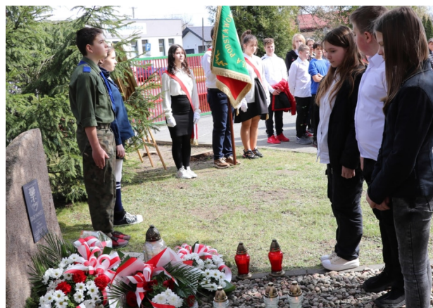
Kwiaty pod obeliskiem złożyli uczniowie szkoły w Białej, a wartę pełnili harcerze ze zgierskich drużyn harcerskich również uczniowie szkoły w Białej