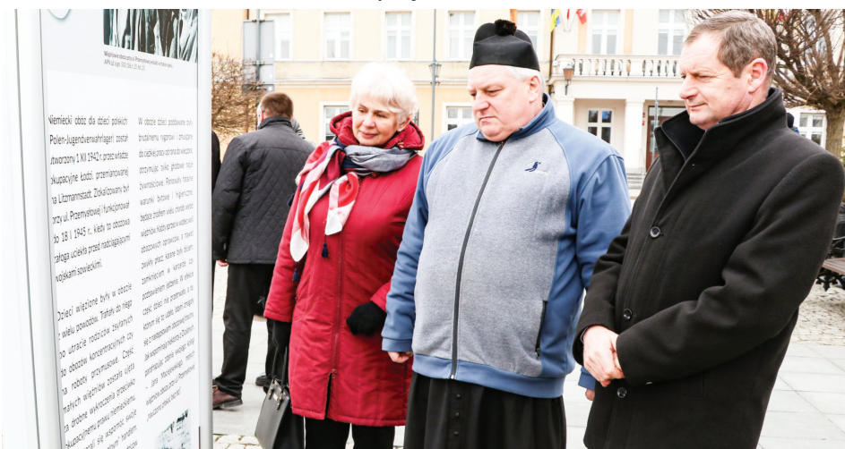
Wystawę poświęconą dzieciom z obozu przy ul. Przemysłowej można oglądać na placu Jana Pawła II w Zgierzu