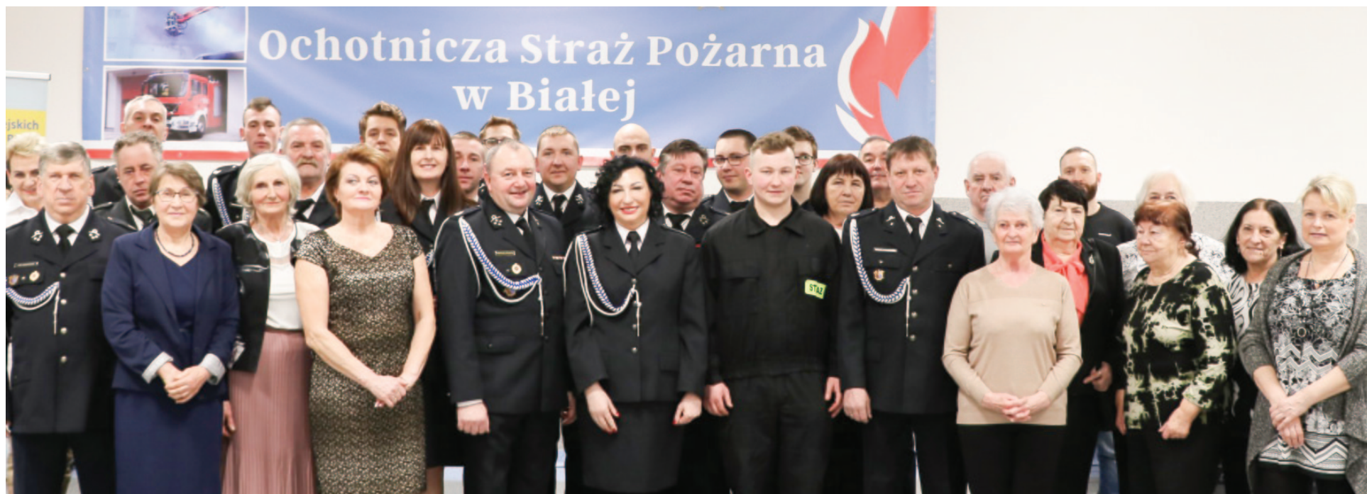
Z zakończonej inwestycji cieszy się cała społeczność sołectwa Biała. - Budynek stał w centrum miejscowości i było już widać, że dawno nie był remontowany. Teraz jest jasny, czysty, razem ze szkołą to wizytówka Białej - podkreślają mieszkańcy. Na zdjęciu strażacy razem z Paniami z Koła Gospodyń Wiejskich z Białej, które zawsze są tam gdzie potrzebna pomoc i trzeba przyjąć zaproszonych gości.

Z wcześniejszych czasów pamiętam pierwsze ciężarowe auto Star 25. To był koniec lat 70 może początek 80. Wówczas KR ZSP przekazywała stary sprzęt jed-