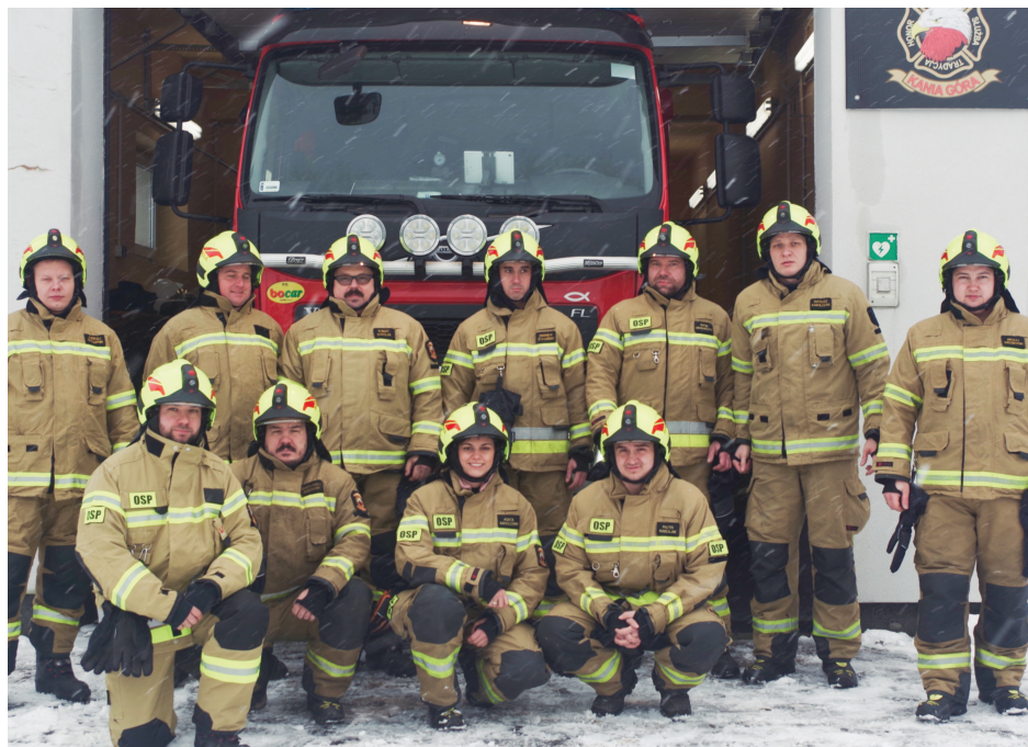
Jesteśmy doświadczoną drużyną - podkreślają Strażacy OSP Kania Góra

Każdy z nas ma swoją pracę więc do zdarzeń wyjeżdżamy w miarę naszych możliwości i wolnego czasu. Nigdy nie wiemy czy zbiegnie się ekipa do wyjazdu. System jest tak pomyślany, że muszą być minimum 3 osoby: kierowca, dowódca i ratownik. W trakcie służby przerobiliśmy niemal wszystkie akcje w jakich straż może uczestniczyć. Jesteśmy doświadczoną drużyną. Nawet jeśli ktoś zaczyna służbę i ma mniejsze doświadczenie może liczyć na pomoc pozostałych, bardziej doświadczonych druhów. Bierzemy udział w akcji, a jednocześnie musimy uważać na bieżący ruch, ludzie często