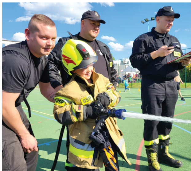
Rośnie nowe pokolenie strażaków