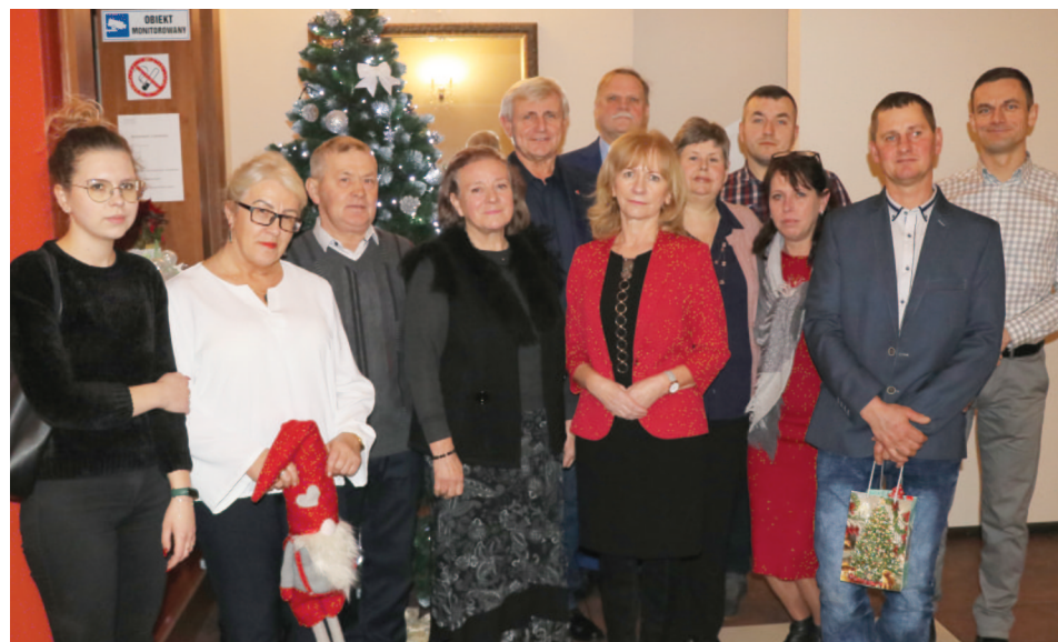
Życzenia złożyli sobie członkowie Klubu Honorowych Dawców Krwi działającego przy szkole w Białej