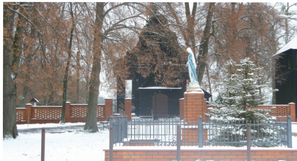
Widok na kościół parafialny w Białej. Drewniany kościółek jest zabytkiem drugiej klasy.