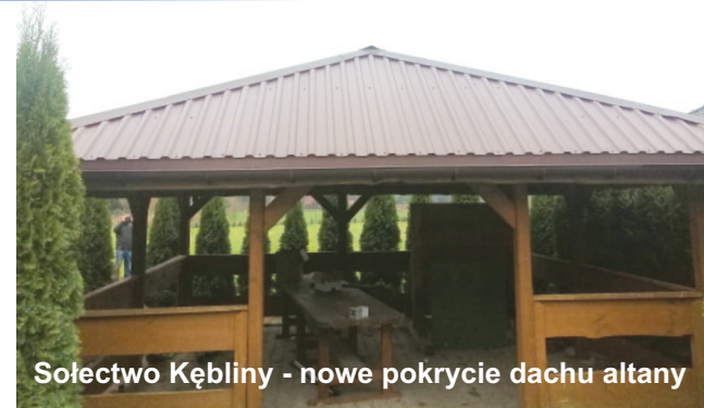
Sołectwo Kębliny - nowe pokrycie dachu altany

montowano ławki parkowe oraz donice z tujami. Całość uzupełnił namiot ogrodowy z ławkami i stołami biesiadnymi. Wszystko w ramach projektu „Zagospodarowanie terenu