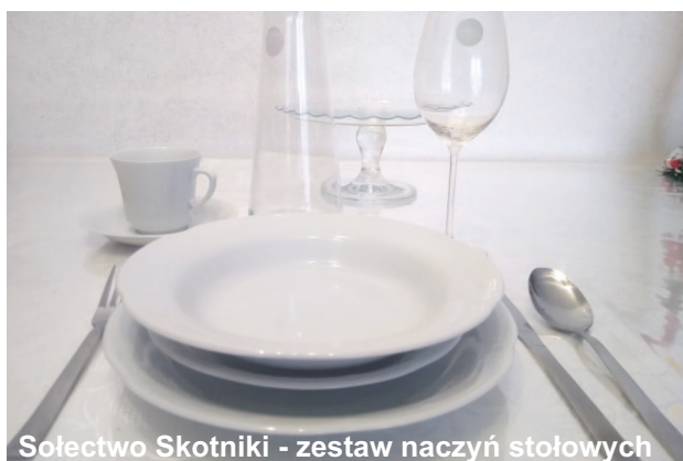
Sołectwo Skotniki - zestaw naczyń stołowych

Gmina Zgierz otrzymała dotację celową przeznaczoną na realizację zadań własnych gminy w zakresie małych projektów w sołectwach. W tym roku dotacje w maksymalnej wysokości po 12.000 zł otrzymały cztery Sołectwa: Kębliny, Skotniki, Szczawin i Wypychów. Mieszkańcy Sołectw decydowali jakie projekty w ramach tej kwoty będą realizować na swoim te-