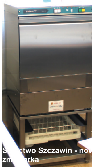
Sołectwo Szczawin - nowa zmywarka