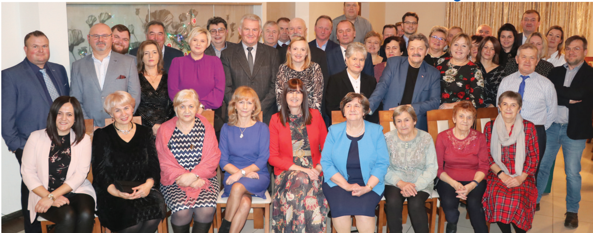
Wspólne, świąteczne spotkanie Radnych Rady i Sołtysów Gminy Zgierz