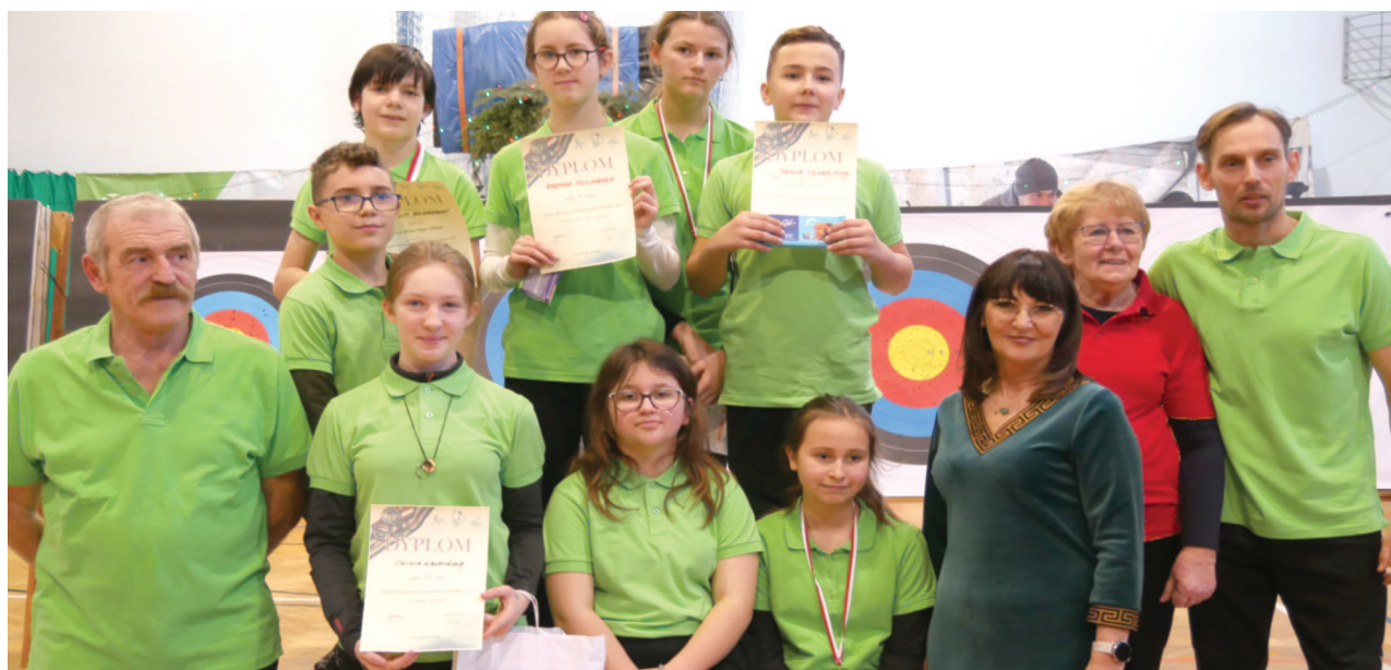
Zawodnicy i kadra LUKS „Czerniawka” podczas zawodów wojewódzkich w szkole w Szczawinie. Jubileuszowe zawody odbyły się na początku grudnia. Oprócz rywalizacji była to również okazja do odebrania gratulacji i przekazania podziękowań za współpracę i wspieranie Klubu.

Tytuł trenera klasy II zdobyła na AWF w Gorzowie. Systematycznie uzupełniała swoją wiedzę sportową i pedagogiczną na kursokonferencjach i szkoleniach. Po zakończeniu kariery sportowej za-