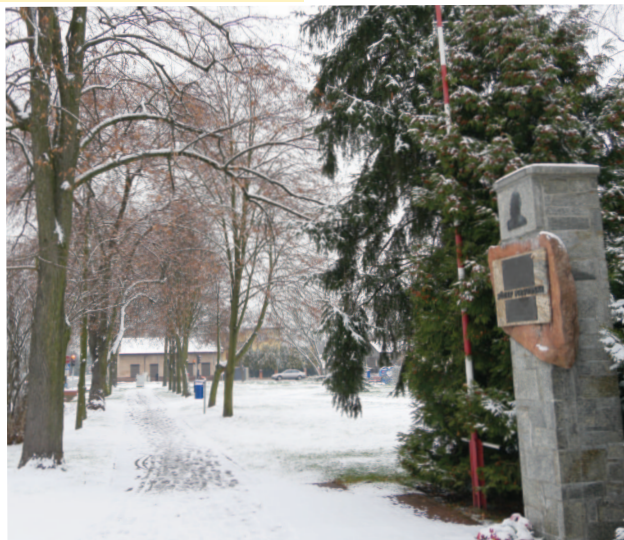
Pomnik Józefa Piłsudskiego, miejsce obchodów rocznic i świąt patriotycznych w gminie Zgierz