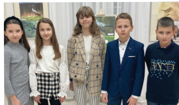
Organizatorzy wystawy - uczniowie klas piątych szkoły w Szczawinie

Spotkanie z fotografami, których pasją są zdjęcia przyrody to cie-