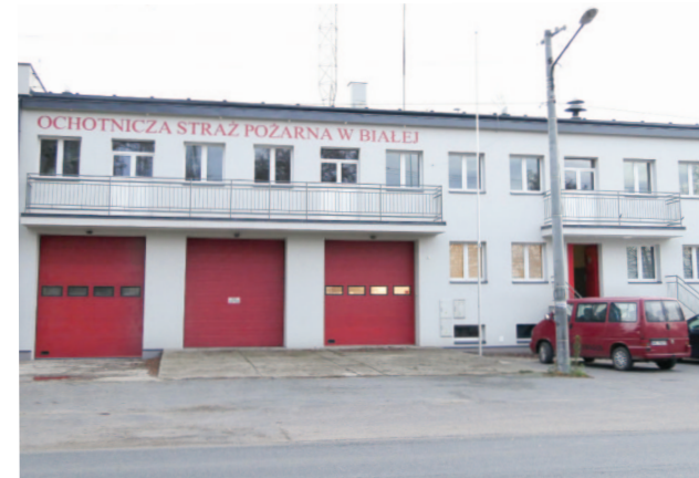
Odnowiona strażnica OSP w Białej

centego Tymienieckiego z 8 listopada 1927 r. powstała nowa parafia wyłączona z parafii w Giecznie i Modnej. Do kościoła prowadzi li-