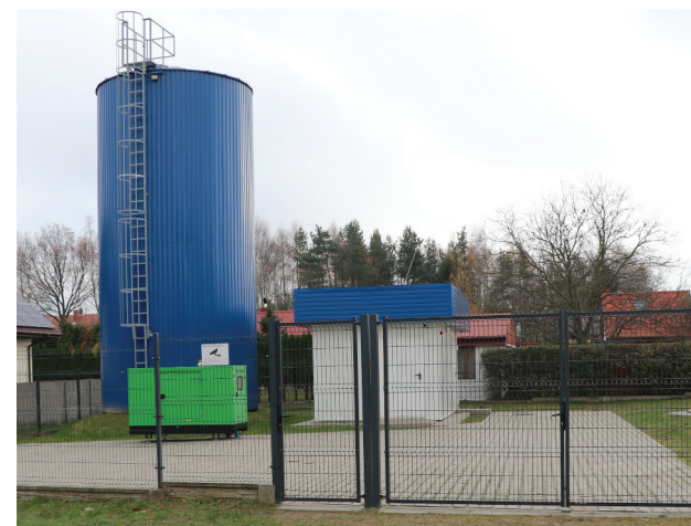
Istniejąca stacja wodociągowa w Janowie

Projekt na budowę zbiornika to pierwszy etap w przygotowaniu inwestycji, która w przyszłości pozwoli zabezpieczyć odpowiednią ilość wody dla mieszkańców miejscowości: Czaplinek, Glinnik, Janów, Józefów, Leonardów, Palestyna, Samotnik i Ukraina.