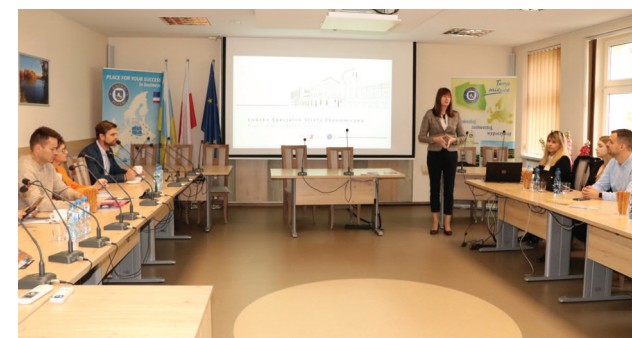
Spotkanie z przedsiębiorcami i przedstawicielami Łódzkiej Specjalnej Strefy Ekonomicznej

Osoby rozwijające swoją działalność w obszarze produkcji, usług magazynowania, usług IT, usług księgowych czy architektonicznych mogą uzyskać od ŁSSE