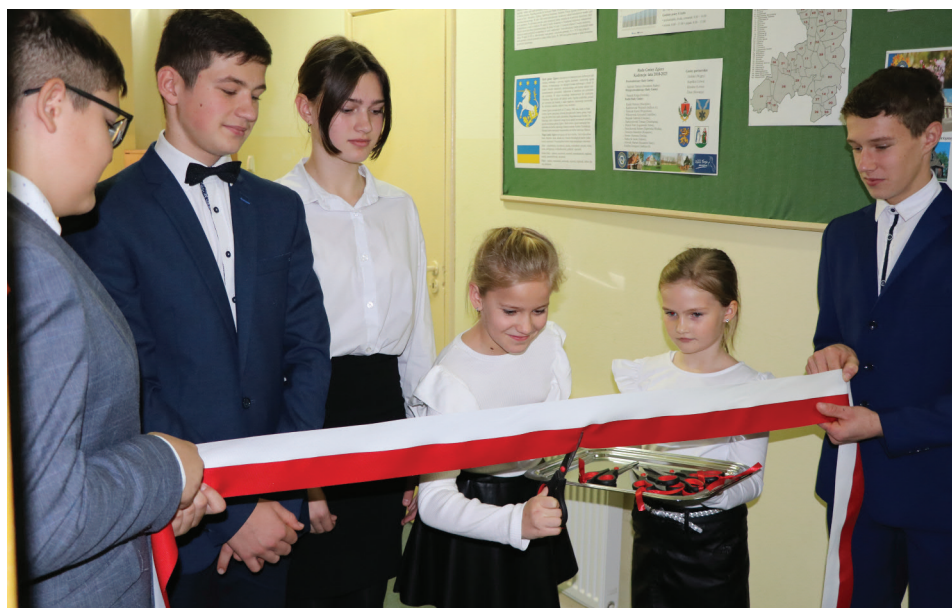
Najważniejsi gospodarze szkoły - uczniowie przecinają wstęgę. Odnowiona szkoła należy teraz do nich!