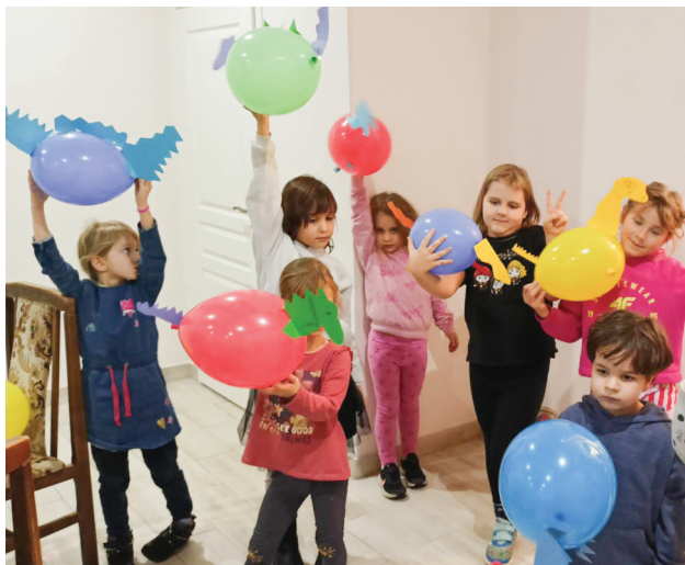
W Gminnym Centrum jest zawsze wesoło i kolorowo

* Biblioteka realizuje projekt „Mała książka – wielki człowiek”. Zapraszamy najmłodszych czytelników!