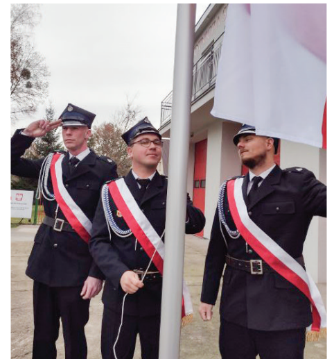
Na nowym maszcie powiewa już flaga Polski, uroczystości wciągnęli ją Druhowie z OSP Biała