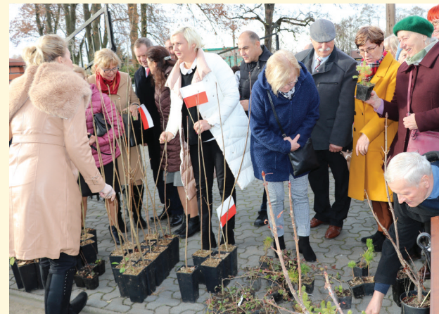
Po mszy wszyscy chętni mogli odebrać sadzonki drzewek i krzewów

Przy pomniku Józefa Piłsudskiego zapłonął Ogień Niepodległości przywieziony przez harcerzy Zgierskiego Hufca ZHP Zgierz. Zgierscy drzewnicy odebrali płomień od harcerzy Hufca Wołyń, wcześniej został on zapa-