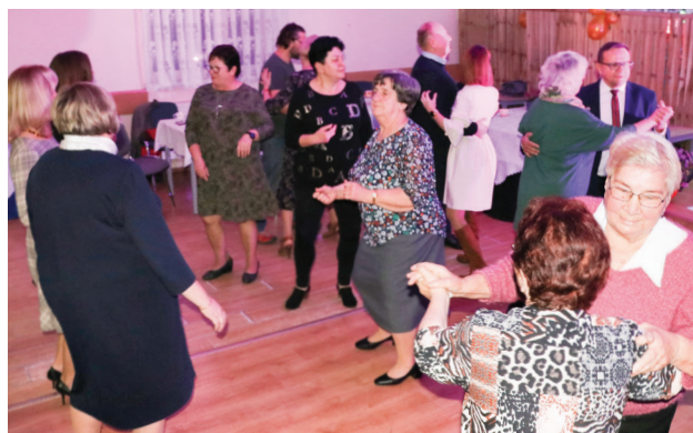
Spotkanie Seniorów zakończyło się wspólnymi tańcami

Dziękujemy Kołu Gospodyń Wiejskich w Łągiewnikach Nowych za przygotowanie słodkiego poczęstunku oraz