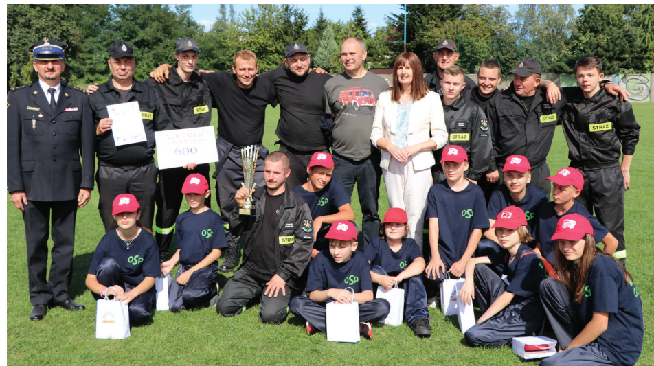
W tegorocznych zawodach strażackich wystartowali Druhowie oraz Młodzieżowa Drużyna Pożarnicza z OSP Ustronie - Grotniki. Na wspólnym zdjęciu z pucharem za I miejsce dla drużyny męskiej OSP Ustronie - Grotniki.