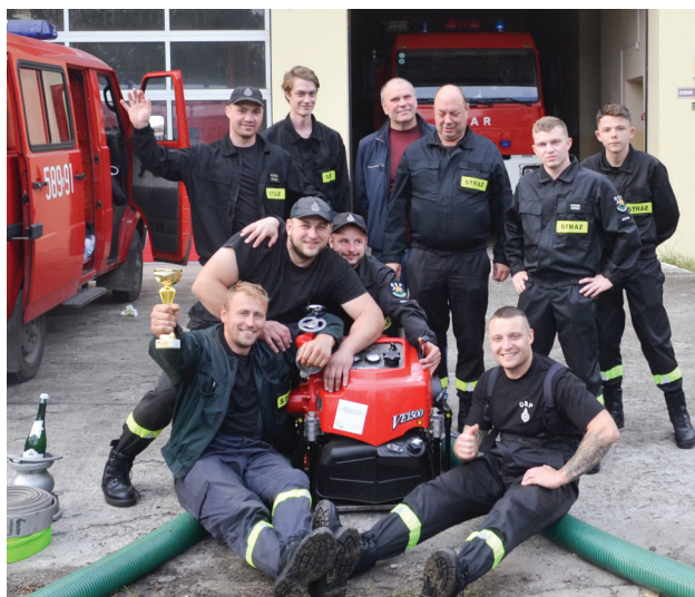
Najważniejszy jest Zespół - wspólne zwycięstwo, wspólna radość!