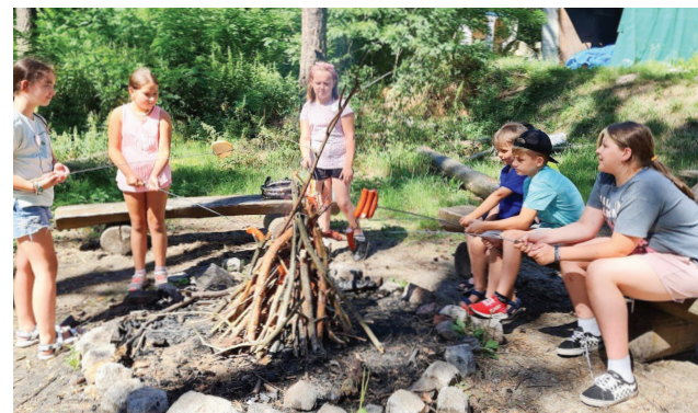
Półkolonie z Harcerzami

Na początku sierpnia w szkole w Grotnikach odbyły się półkolonie pod nazwą "Letnia przygoda z harcerzami". W trakcie zajęć dzieci rozwijały swoją kreatywność, wyobraźnię i sprawność fizyczną. Nabyły umiejętności występów publicznych, samodzielnego organizowania czasu, dzięki spotkaniu z policjantami poznały zasady bezpieczeństwa podczas wakacji. Do udziału w bezpłatnych zajęciach dzieci zaprosili Harcerze Hufca ZHP Zgierz i Wójt Gminy Zgierz.