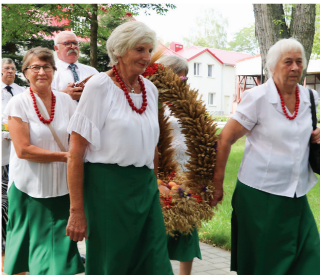
Wieniec dożynkowy przygotowały Panie z KGW Biała