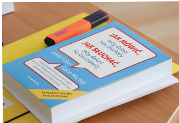
Szkoła dla rodziców to pierwszy taki program szkoleniowy w Gminie Zgierz

z prowadzącymi Szkołę dla Rodziców podczas sześciu zajęć warsztatowych.