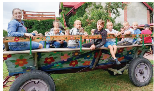
Wakacyjna przygoda w Dzierżanej

Na początku sierpnia w szkole w Grotnikach odbyły się półkolonie pod nazwą "Letnia przygoda z harcerzami". W trakcie zajęć dzieci rozwijały swoją kreatywność, wyobraźnię i sprawność fizyczną. Nabyły umiejętności występów publicznych, samodzielnego organizowania czasu, dzięki spotkaniu z policjantami poznały zasady bezpieczeństwa podczas wakacji. Do udziału w bezpłatnych zajęciach dzieci zaprosili Harcerze Hufca ZHP Zgierz i Wójt Gminy Zgierz.