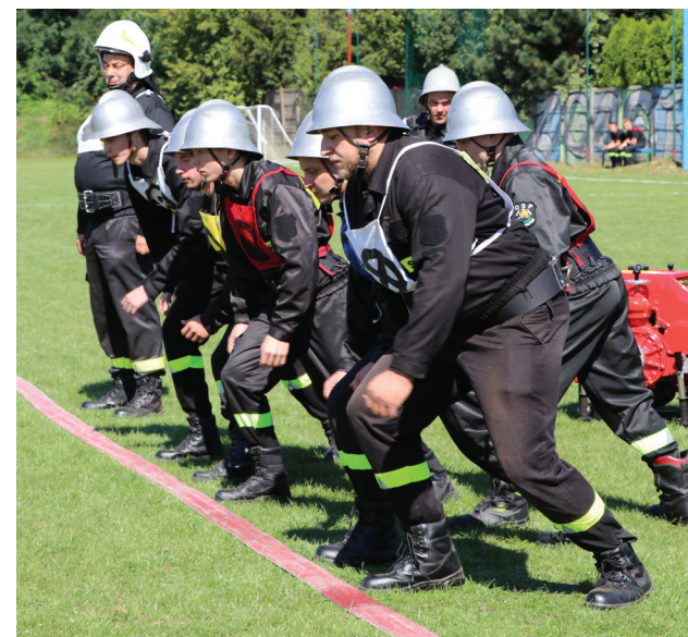
Do startu gotowi...