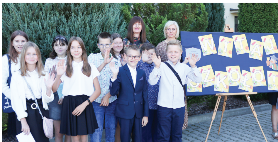
Rozpoczęcie Roku Szkolnego w Szkole Podstawowej w Giecznie