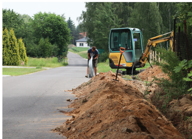
Na początku lipca rozpoczęła się budowa oświetlenia w ul. Truskawkowej. Następną w kolejności jest ul. Ku Słońcu. Obydwie w Glinniku