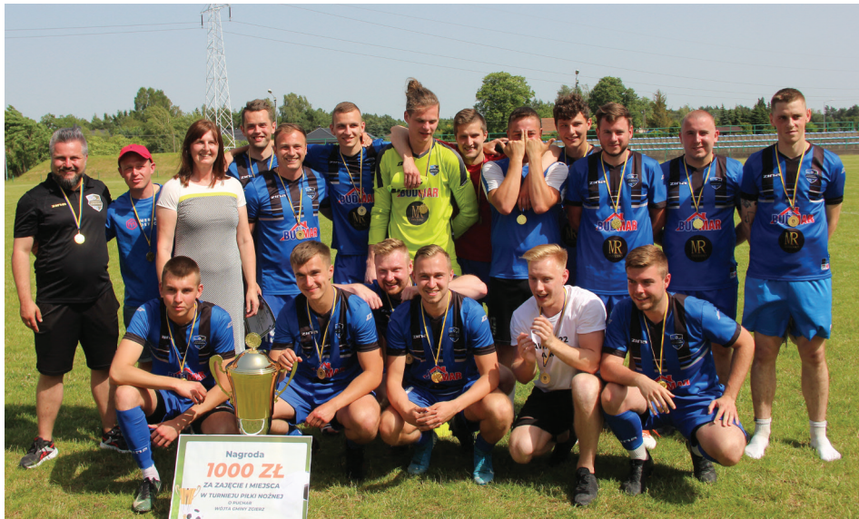
Zwycięzcy - KS Rosa Rosanów odebrali Puchar Wójta Gminy Zgierz oraz nagrodę pieniężną

W czasie kiedy na boiskach trwały rozgrywki, rodziny z dziećmi kibicowały piłkarzom i spędzały wspólnie czas na pikniku. Obok rozmaitych propozycji zabaw na świeżym powietrzu i bezpłatnych dmuchańców, rodziny mogły wspólnie zagrać w gry planszowe i porozmawiać z pedagogiem o uzależnieniach od mediów społeczności-