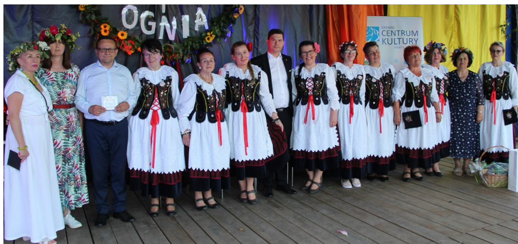
Zespół Szczawiniarki świętował 20-lecie istnienia