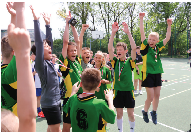
Radość ze zwycięstwa - drużyna ze szkoły w Białej

Klasyfikacja pozostałych drużyn: II miejsce zajęła szkoła w Słowiku III miejsce przypadło drużynie ze szkoły w Szczawinie Kościelnym