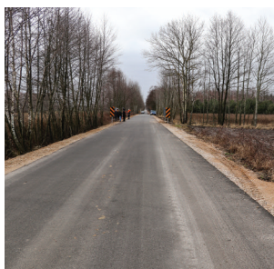
Ulica Romanowska z nową nawierzchnią, wcześniej była to droga gruntowa