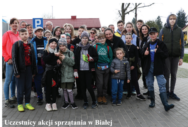
Uczestnicy akcji sprzątania w Białej