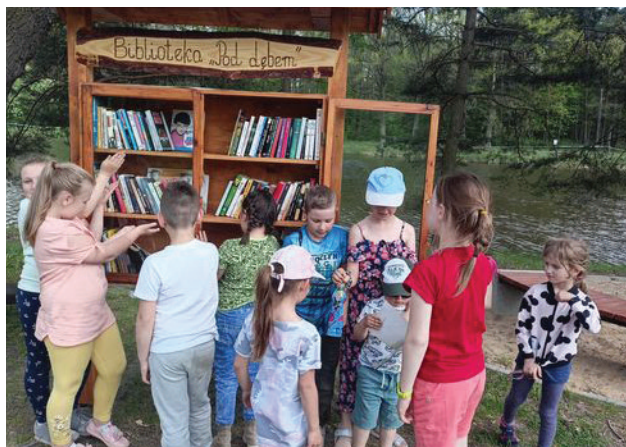
Pierwsi, młodzi czytelnicy biblioteki „Pod dębem”. Biblioteka plenerowa będzie czynna od wiosny do jesieni

[na podstawie info GCKSTiR z/s w Dzierżąnej]