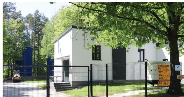
Remont i modernizacja stacji uzdatniania wody w Ustroniu to duża i bardzo potrzebna inwestycja dzięki której mieszkańcy mają bezawaryjny dostęp do wody

proces technologiczny jest w pełni zautomatyzowany. Wymieniono elementy hydrauliczne. System ma nowe pompy