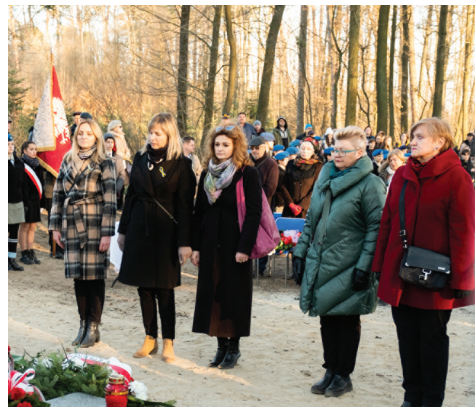
Podczas uroczystości kwiaty złożyli dyrektorzy gminnych szkół. Społeczność szkolną reprezentował sztandar z SP w Słowiku