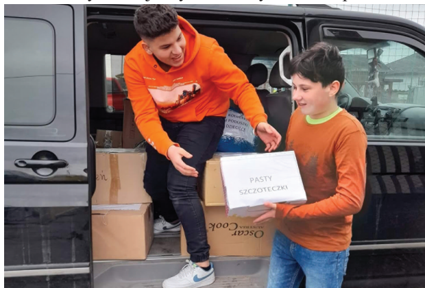
Każda pomoc jest potrzebna i ważna

Przed nami jeszcze większe wyzwania, sprawdzian solidarności, empatii i chęci niesienia pomocy. Teraz każda zaoferowana pomoc jest potrzebna i ważna.