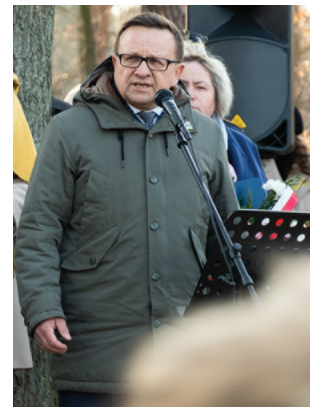
Głos zabrał Posł na Sejm RP Marek Matuszewski

Mogiła w Lesie Lućmierskim jest faktycznym miejscem pochówku rozstrzelanych w Zgierzu 100 Polaków. Badania archeologiczne prowadzone w tym miejscu na przełomie 2012 – 2013 roku pozwoliły na identyfikację ekshumowanych szczątków ludzkich. Teraz w miejscu dawnej mogiły znajduje się krzyż i tablice z nazwiskami pomordowanych. To również miejsce symboliczne dla wszystkich ofiar, bowiem Las Lućmierski był w czasie II wojny światowej miejscem egzekucji ludności cywilnej z regionu Łodzi i okolic.