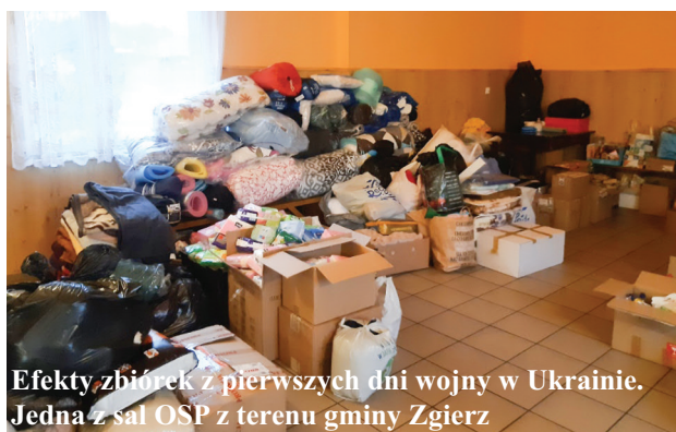
Efekty zbiórek z pierwszych dni wojny w Ukrainie. Jedna z sal OSP z terenu gminy Zgierz

Bieżące informacje związane z pomocą dla obywateli Ukrainy na terenie gminy Zgierz publikujemy systematycznie na stronie: gminazgierz.pl/informator/pomoc-dla-ukrainy/ i na https://www.facebook.com/gminazgierz/