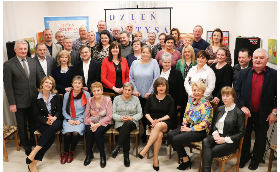
W Gminie Zgierz mamy ponad 14 tysięcy mieszkańców i 40 sołectw. Sołtysi to bezpośrednia i niezastąpiona reprezentacja Samorządu w terenie