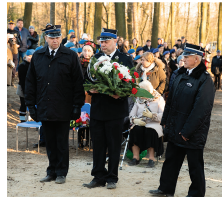
Kwiaty złożyła delegacja OSP z terenu gminy, a jednostki reprezentowały delegacje ze sztandarami