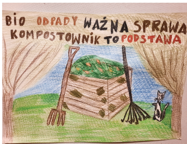
autor: Magdalena Nowak