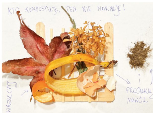
autor: Aleksander Cebulski

Ze względu na ograniczoną ilość miejsca w tym numerze prezentujemy tylko niektóre prace dzieci, będziemy jeszcze wracać do laureatów konkursu i ich prac.