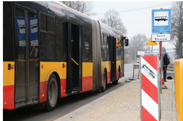
Nowe przystanki poprawią bezpieczeństwo pasażerów czekających na autobus