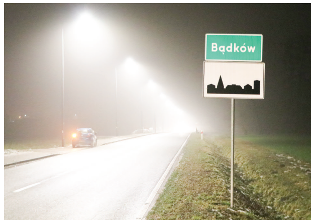
Jest już widniej między innymi na trasie z Bądkowa do Warszycy

Dwie inwestycje oświetlenia dróg Biała - Cyprianów i Bądków - Kotowice, zostały zrealizowane w 2021 r. w ramach projektu „Zastosowanie energooszczędnego oświetlenia dróg publicznych na terenie gminy Zgierz - I etap”. Lampy stanęły przy drodze Biała - Cyprianów. To odcinek około 1,5 kilometra, na którym ustawiono 39 słupów z oprawami oświetleniowymi w technologii LED.