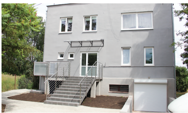
Budynek Ośrodka zdrowia w Słowiku

- W takiej sytuacji, mając na względzie dobro Mieszkańców jak najszybciej zostanie podany do publicznej wiadomości na okres 21 dni wykaz lokalu