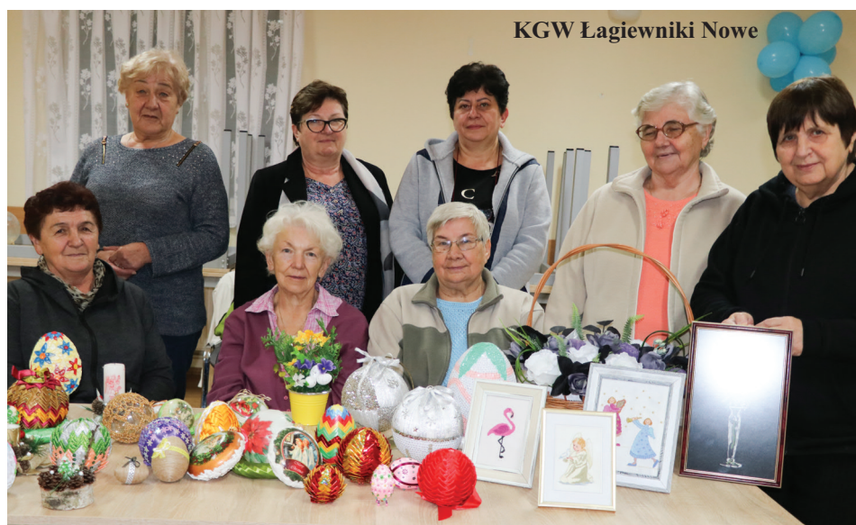
KGW Łagiewniki Nowe

cego – piwowarów i miodowarów, którzy towarzysząc księciu w podróżach przechowywali te napoje w łagwiach. Jakby nie było, nazwa jest jedną z najstarszych na tym terenie.