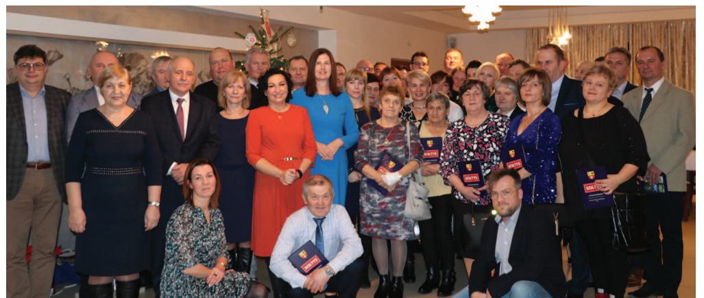
Spotkanie Radnych i Sołtysów z terenu gminy Zgierz