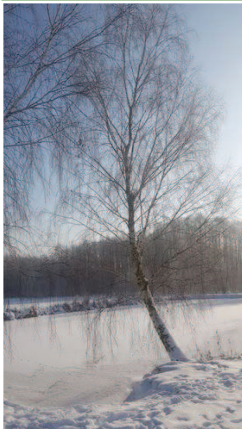
Zdjęcia naszych Mieszkańców