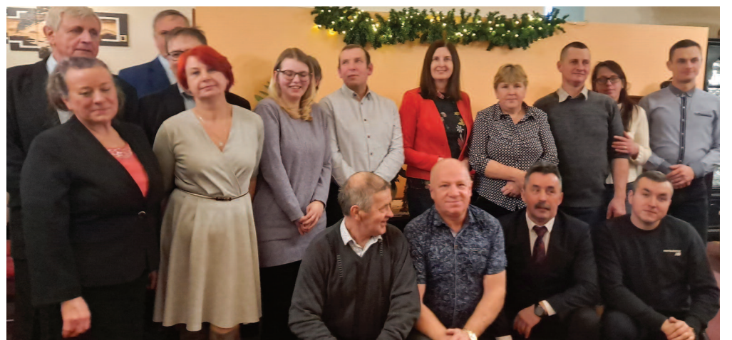
Klub Honorowych Dawców Krwi działający przy SP z Białej