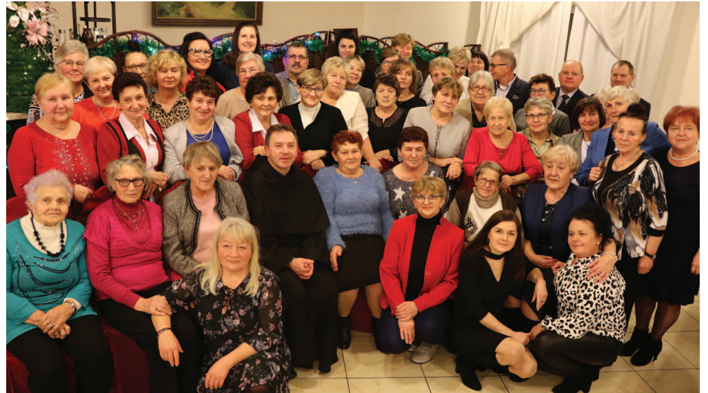
Wspólne popołudnie w świątecznej atmosferze spędziły Panie z Kół Gospodyń Wiejskich