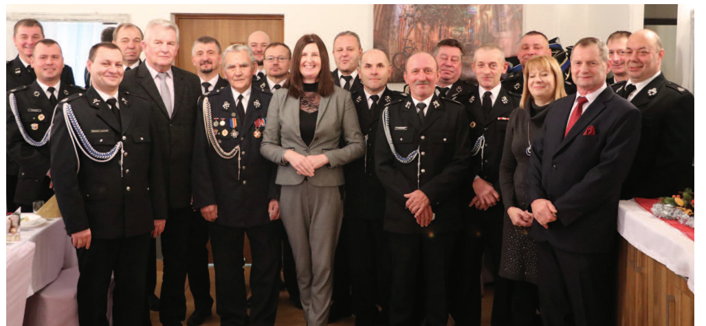
Wesołych Świąt życzyli sobie wzajemnie Druhowie Ochotniczych Straży Pożarnych