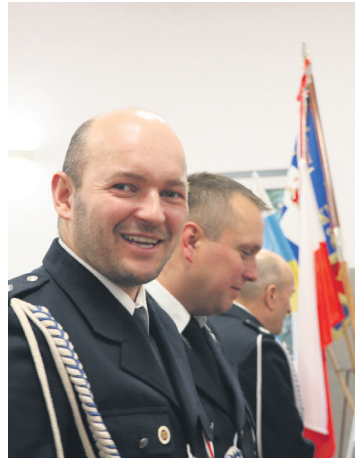
foto: Zjazd Oddziału Gminnego Związku OSP odbywa się co pięć lat. Obok podsumowania działalności i wyborów jest też czas na wspomnienia. Zainteresowaniem cieszyła się wystawa zdjęć prezentująca strażackie wydarzenia z ostatnich pięciu lat.