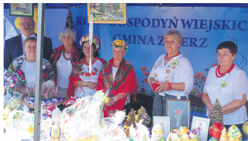
foto: Rękodzieło prezentowały Panie z KGW z Rosanowa, Białej i Łagiewnik Nowych