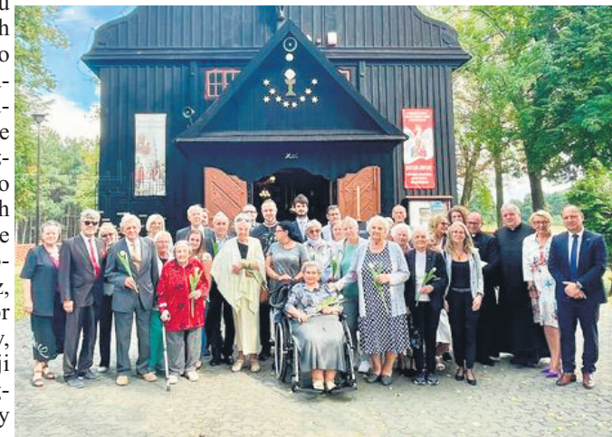
foto: Wspólna fotografia uczestników spotkania w GCKSTiR z/s w Dzierżąnej, po mszy w kościele w Białej.

Następnego dnia goście odwiedzili również GCKSTiR w Dzierżąnej, po mszy w kościele w Białej.