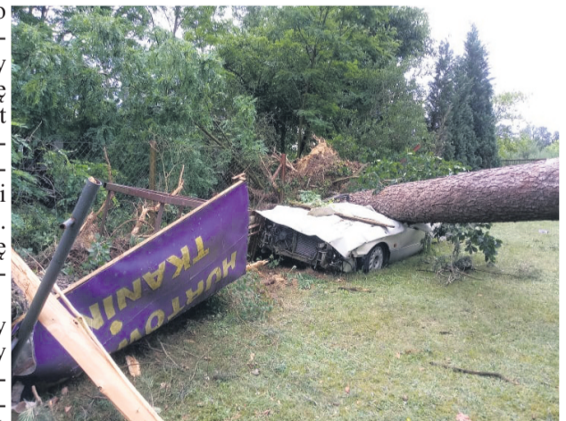
foto: Powalone drzewa powodowały uszkodzenia i straty mieszkańcom.

Referat Ochrony Środowiska i Rolnictwa wydawał bez zwłoki pozwolenia na usunięcie połamanych lub wyrwanych podczas burz drzew.