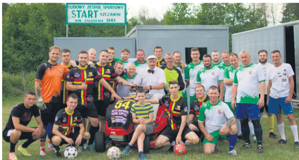
foto: Zawodnicy i kadra LKS Start Szczawin

- Bardzo ważne dla drużyny są wyniki. W tym sezonie zajęliśmy 6. miejsce, tuż za czołówką, która walczyła o awans do A klasy. Integracje drużyny widać również