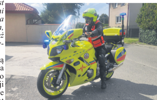
foto: Oznakowany motoambulans