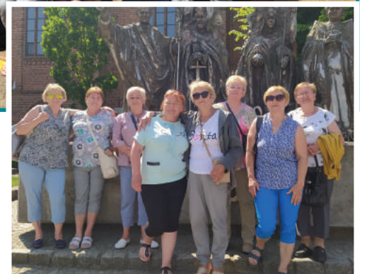
foto: Seniorzy podczas wyjazdu turystyczno-krajoznawczego w Ustroniu Morskim współorganizowanym przez Gminę Zgierz.