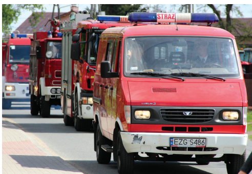
foto: bezpieczeństwo na terenach wiejskich zależy od przygotowania Straży

Mamy 10 jednostek w tym 5 jest włączonych do Krajowego Systemu Ratowniczo-Gaśniczego. To jednostki w Białej, Dzierżąnej, Kaniej Górze, Skotnikach