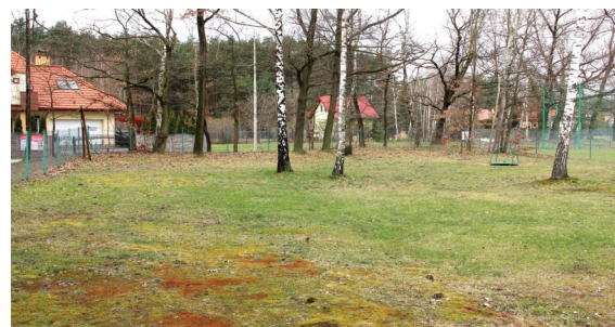
foto: plac w Rosanowie pod strefę zabaw dla dzieci

W kwietniu wyłoniono wykonawcę na realizację budowy otwartej strefy aktywności w Rosanowie. W ramach projektu powstanie siłownia plenerowa, w której przewidziano również urządze-