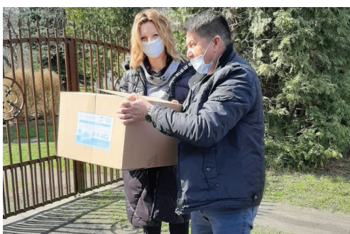
foto: bezpłatne maseczki trafiły do Sołtysów

Mając na względzie obowiązujące obostrzenia oraz konieczność zachowania zasad bezpieczeństwa, aby nie tworzyć skupisk ludzi maseczki otrzymają sołtysi i to oni zajmą się ich dystrybucją wśród mieszkańców sołectw. Płyny do dezynfekcji trafią do jednostek OSP, pracowników