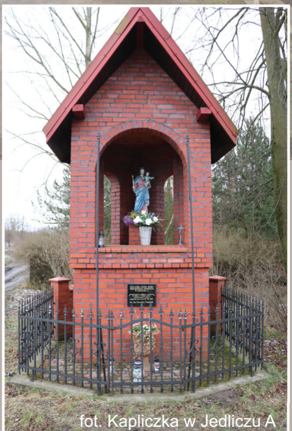
fot. Kapliczka w Jedliczu A