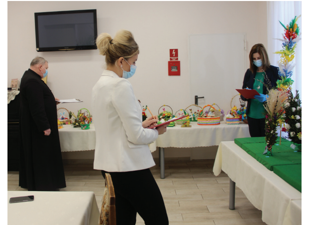
foto: komisja konkursowa oceniała wielkanocne prace

Komisja długo i wnikliwie przyglądała się wszystkim pracom, brała pod uwagę technikę wykonania, inwencję twórczą, pomysłowość, estetykę, użyte materiały, ale przede wszystkim widoczny wkład pracy dzieci. Wszystkie prace zarówno palmy jak i koszyczki po prostu zachwycaly, wszystkie były radosne i kolorowe.