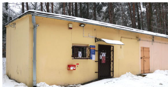
foto: budynek poczty w Grotnikach

W kwietniu została podpisana umowa na termomodernizację budynku gminnego, w którym znajduje się