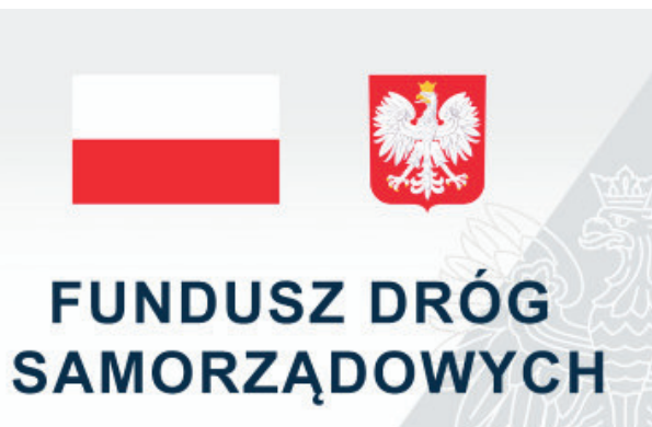
foto: baner inwestycji

W kwietniu nastąpiło przekazanie wykonawcy placu budowy ul. Romanowskiej w Kęblinach. Budowa drogi będzie realizowana na odcinku ponad 2 kilometrów. Zakres prac obejmie między innymi wykonanie jezdni o nawierzchni bitumicznej na podbudowie z tłuczni, poboczy i zjazdów. Wykonawca jest zobowiązany do zapewnienia podczas prac tymczasowej organizacji ruchu. Wartość inwestycji to kwota ponad 1.897.000,00 zł. Zakończenie planowane jest na początek 2022 roku.