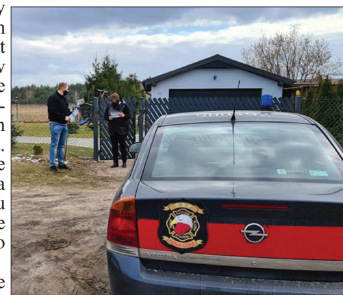
foto: Strażacy OSP Kania Góra roznosili ulotki z informacjami o szczepieniach

Z wielkim żalem przyjęliśmy wiadomość o śmierci