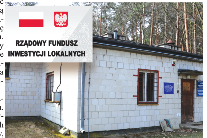
foto: Stacja uzdatniania wody w Ustroniu