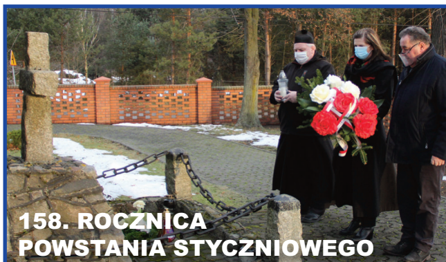
158. ROCZNICA POWSTANIA STYCZNIOWEGO