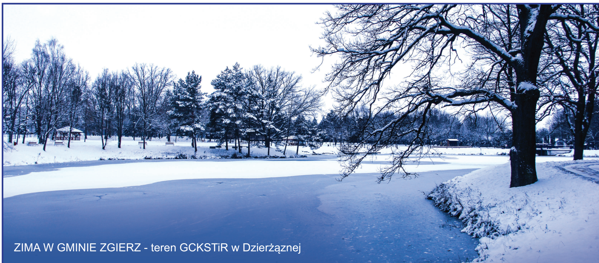
ZIMA W GMINIE ZGIERZ - teren GCKSTiR w Dzierżanej

Rozlicz PIT tam gdzie mieszkasz i miej wpływ na rozwój gminy