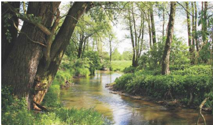
Moszczenica w okolicach Gieczna

Z okazji 40. urodzin wypada życzyć gminie Zgierz pomyślnego i przyjaznego mieszkańcom rozwoju oraz zachowania walorów piękna środowiska naturalnego, które niewątpliwie wyróżnia naszą gminą wspólnotą!