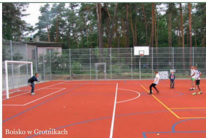
Boisko w Grotnikach