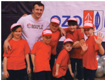
Zespół Tańca Nowoczesnego RAINDROPS - Junior.

lokalnych występach oraz biorą udział w przeglądach i festiwalach. Przed „Ozodance” nasi uczestnicy byli bardzo zaaferowani czekającym je występem tanecznym. Na szczęście taniec udało im się wspaniale! Nasze pociechy dały z siebie wszystko, prezentując się na scenie. Młodym członkom zespołu serdecznie dziękujemy za występ.