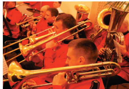
Orkiestra Dęta działająca przy Gminnym Ośrodku Kultury w Dzierżąnej.

To już kolejny występ Orkiestry Dętej działającej przy Gminnym Ośrodku Kultury w Dzierżąnej i Orkiestry Dętej Ochotniczej