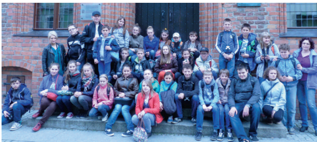
Przed Domem Mikołaja Kopernika w Toruniu.