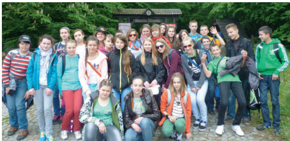
W Puszczy Jodłowej.

Wycieczki dostarczyły młodym podróżnikom wiele wrażeń, a pobyt