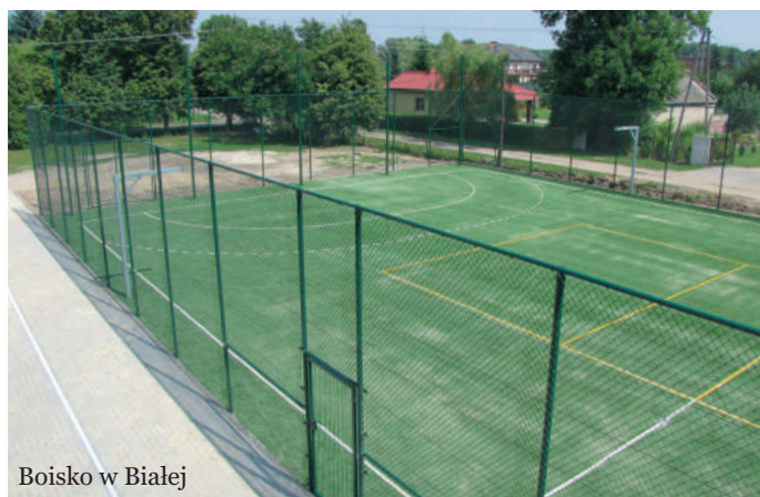
Boisko w Białej

Uprawianie sportu jest filarem zdrowego trybu życia. Jest też aktywną formą spędzania wolnego czasu. W Gminie Zgierz mamy kilka obiektów, które dają możliwość rozwijania sportowych pasji i talentów mieszkańców gminy.