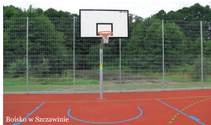
Boisko w Szczawinie