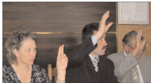
Radni podczas głosowania nad uchwałą w sprawie nadania imienia szkole w Szczawinie

działania. Ze strony Urzędu Gminy Zgierz, poza czynnościami ewidencyjnymi, podejmowane są wszelkie starania zmierzające do ułatwienia interesantom formalnego załatwienia spraw związanych z rozpoczęciem lub zmianami w działalności (od ręki i w jednym okienku). W miarę posiadanych informacji, przekazywane są przedsiębiorcom oferty preferencyjnych kredytów, szkoleń, bezpłatnych seminariów dotyczących prowadzenia własnej firmy oraz oferty współpracy z zagranicą. Przedsiębiorcy zapraszani są także do nieodpłatnego uczestnictwa w targach