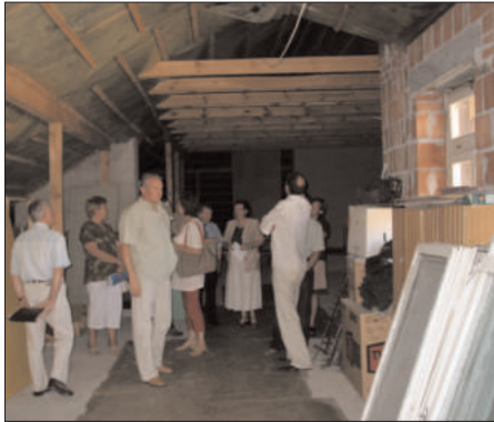
Komisja Infrastruktury Społecznej dokonała m.in. oglądzin poddasza w Szkole Podstawowej w Białej

Członkowie Komisji wizytowali gminne szkoły w Besiekierzu Rudnym, Słowiku, Grotnikach oraz Dębrowce Wielkiej, Białej i Szczawinie.