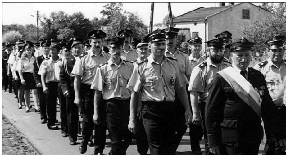
Podczas obchodów 50-lecia Ochotniczej Straży Pożarnej w Kłblichach - 1998 rok.

W roku 1983 i 1989 jednostka zajmuje I miejsce w Gminnych Zawodach Sportowo-Pożarniczych.