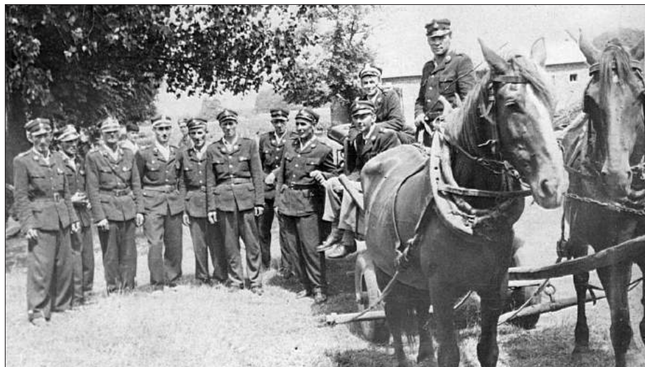
Zawody pożarnicze w Białej - 1962 rok.

Narodowej w Białej. W 1977 roku dobudowano garaż na samochód bojowy. Rok później jednostka otrzymuje samochód bojowy marki Star 25.