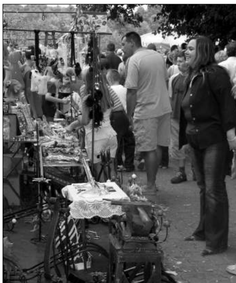
Uroczysto ciom oficjalnym towarzyszy y kiermasze, stoiska gastronomiczne i weso e miasteczko

Gospodarzom Gminy wieniec wr czy o KGW z Gieczna. Wieniec dla Ministerstwa Rolnictwa i Rozwoju Wsi odebra