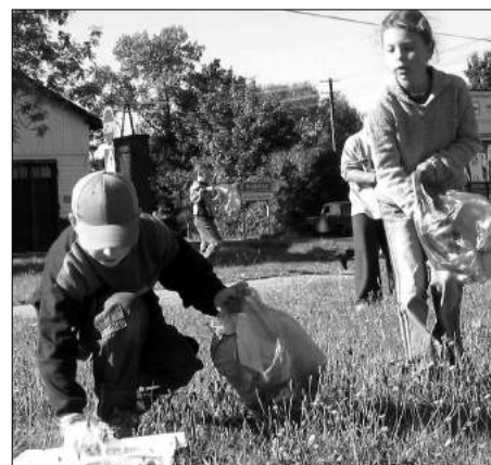
znaleli czas i serce aby uczynić naszą gminę bardziej czystą.

Referat Ochrony środowiska, Rolnictwa i Leśnictwa, Gospodarki Wodnej Urzędu Gminy Zgierz pragnie Wszystkim uczestnikom akcji bardzo serdecznie podziękować za to, że