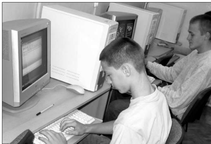
Dziś ki pracowni internetowej zwiększyła się liczba zaję z informatyki

Teraz w szkole są dwie pracownie komputerowe. Pozwoli o to rozszerzyć liczbę zaję z informatyki. Z komputerami pracują naj młodsi klasy 1-3, dla których w szkole wprowadzono godzinę informatyki tygodniowo. Wiadomo ci doskonale swoich umiejętności i mają również uczniowie z koła informatycznego. Z komputerem bardzo korzysta nie