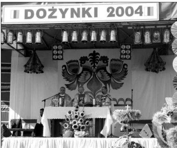
Na początku uroczystość odbyła się msza, po której został rozdany chleb i wieńce dożynekowe

Szczególny charakter ma ta ceremonia wręczenia wieńców dożynekowych. Co roku goście mogą podziwiać kunszt