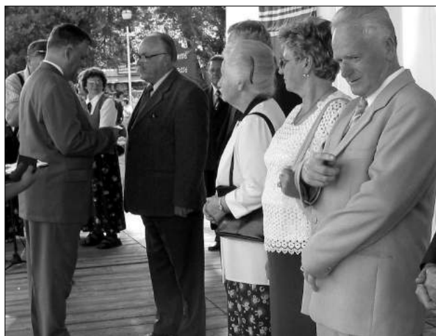
Odznaczeni odznak honorow Zas u ony dla Rolnictwa