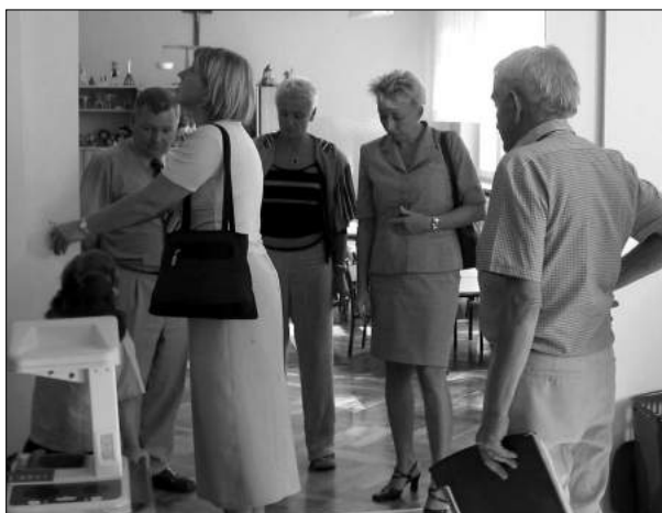
Wszystkie szko y prowadzi y remonty, prace zako czono przed pierwszym dzwonkiem

pomieszcze , cyklino wanie i lakierowanie pod g, wymiana drzwi, remont pomieszczenia kuchennego, grodzenie placu zabaw - to prace, kt re wykonane zosta y w szkole w Grotnikach . Przede wszystkim jednak zrealizowana zosta a ca kowita modernizacja toalety przedszkolnej przy udziale rodk w pomocowych UE pochodz cych z Programu Aktywizacji Obszar w Wiejskich. W S owiku cyklino wano i pomalowano pod ogi w salach