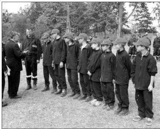
Po raz pierwszy w zawodach, najmłodszy strażacy z OSP Ustronie

Atrakcyjnego rocznych zawodów był pokaz sprawności w wiczeniach bojowych i sztafecie Młodzie owej Drużyny Poarnicznej z Grotnik -