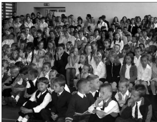
1 wrze nia w szkole w S owiku

lekcyjnych, umalowano kilka pomieszcze , odnowiono krzes a w klasach I-III i w zer wce, a tak e urz dzony zosta plac zabaw i teren wok szko y.