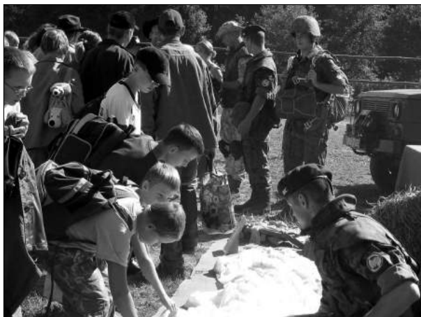
Zainteresowanie wzbudził sprzęt wojskowy