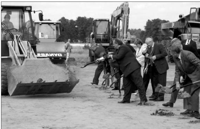
Pierwsze opłaty ziemi na nowobudowanym odcinku autostrady

Dwa pierwsze odcinki w 85 proc. finansowane są ze środków w unijnych, a w 15 proc. z budżetu państwa. Odcinek Emilia - Stryków w 75 proc. pokryty zostanie ze środków unijnych, reszta z budżetu.