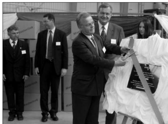
Symboliczne przeci cie wst gi

- Dobra wsp praca w adz gminy z inwestorami ma zach ci kolejne przedsi biorstwa