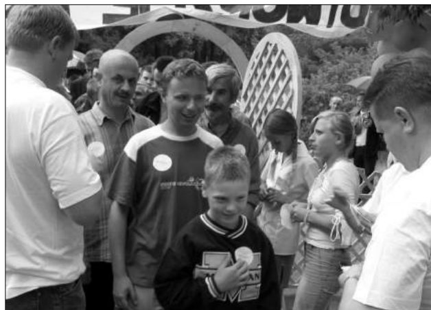
Symboliczne przejście przez drzwi na rozpoczęcie festynu

ścia przez drzwi, to symboliczny gest przełamania barier w kontaktach między osobami zdrowymi i chorymi. W programie znalazły się występy na scenie mieszkańców w DPS Ustronie, którzy zaprezentowali spektakl zatytułowany Wszystko co jest najważniejsze na świecie. Nieco później odbył się mecz koszykówki z udziałem pracowników w DPS - w oraz drużyny VIP-ów, a także zawody sportowe w których rywalizowały drużyny z poszczególnych placówek opieku-