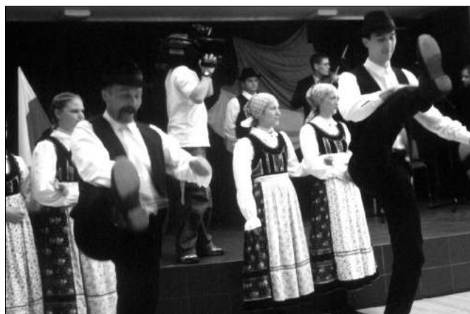
Występ węgierskiego zespołu ludowego

Wieczorem w Pałacu Poznańskich w Łodzi odbyła się uroczystość otwarcia Konsulatu Republiki Węgierskiej w Łodzi, w której uczestniczyli dyrektorzy Zespołu