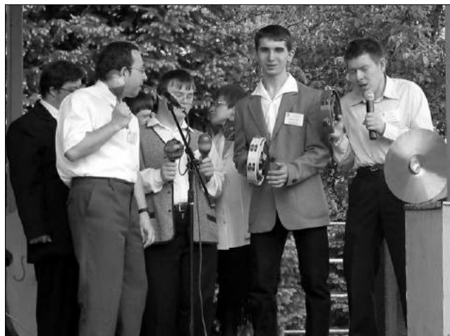
Podczas pikniku wystąpił zespół muzyczny

Centrum powstaje z inicjatywy rodziców i opiekunów w celu zapewnienia przyszłości warunków do godnego życia osób z niepełnosprawnościami. Rodziki finansowe pochodzą z wpłat rodziców oraz ofiarodawców. Budowa rozpoczęła się w Zgierzu.