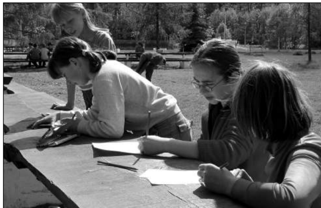
Dzieci malowały pocztówki z Dzieżonej

Uczestnicy omawiali podczas warsztatów tematy ważne dla młodych ludzi, między innymi dorastanie, uczucia i emocje z nimi związane. Starali się uświadomić sobie poczucia obecności osoby odtrąconej przez grupę; uświadomić jak atakują innych. Wszystkie zadania i ćwiczenia podczas warsztatów oparte zostały o utwory literackie. Wcześniej, przygotowując się do zajęć, dzieci czytały lektury Ireny Jurgielewiczowej Ten obcy i Inna.