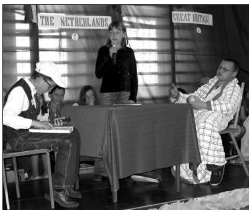
W scenkach rodzajowych uczniowie prezentowali znajomo j zyka angielskiego

Rywalizacj rozpoc to od przedstawienia w spos b ciekawy, cz sto zabawny wybranego przez poszczeg lne szko y kraju nale cego do Unii Euro-