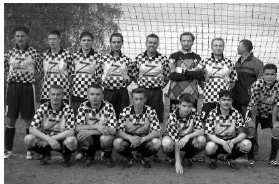
Drużyna LKS Rosan w