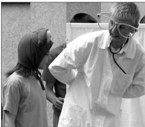
Dzieci zaprezentowa y si w programie artystycznym z inscenizacjami wierszy J. Brzechwy

Okr g y jubileusz sta si okazj do spotkania by ych wychowan w i pracownik w Domu Dziecka. Obecni byli przedstawiciele sponsor w, kt rzy od lat wsp pracuj z Domem, przedstawiciele samorz d w, kt rzy wspieraj dzia ania wychowan w i opiekun w oraz wiele