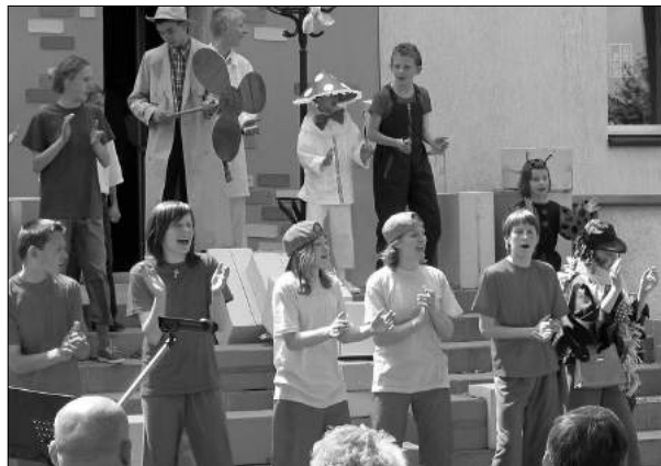
Roz piewany Dom w D br wce

Domem na pustkowiu , jak go wcze niej nazywano. Rozszerza a si Dzia alno rozpocz a dru yna harcers-