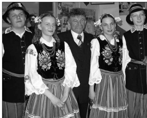
Podczas targów na scenie wystąpił zespół Szczawiniacy

nauczycieli i uczniów. Proponowane także edukacyjne ścieżki historii i kultury regionu. Szczególnym powodzeniem wśród odwiedzających targi cieszy się otwarty w ubiegłym roku rowerowy szlak agrotu-