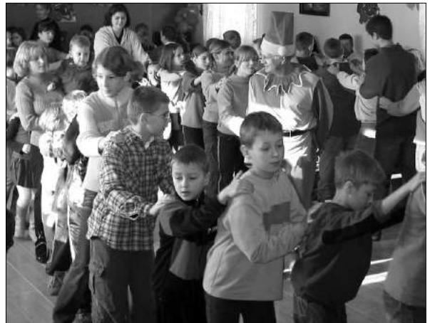
Mikołajki dla dzieci w wietlicy w Łagiewnikach

W ubiegłym roku starczyło jeszcze na wykonanie wielu prac w budynku i na terenie posesji. Zmodernizowaliśmy kuchnię, gdzie została połączona nowa