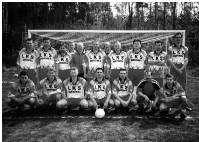
LKS D br wca

W 1994 roku LZS D br wca (zmiana na LKS w 1992 roku) podpisał umowę ze Spółdzielni Produkcyjną w D br wce o wydzierżawienie działki. Dzięki temu wysiłkami działaczy