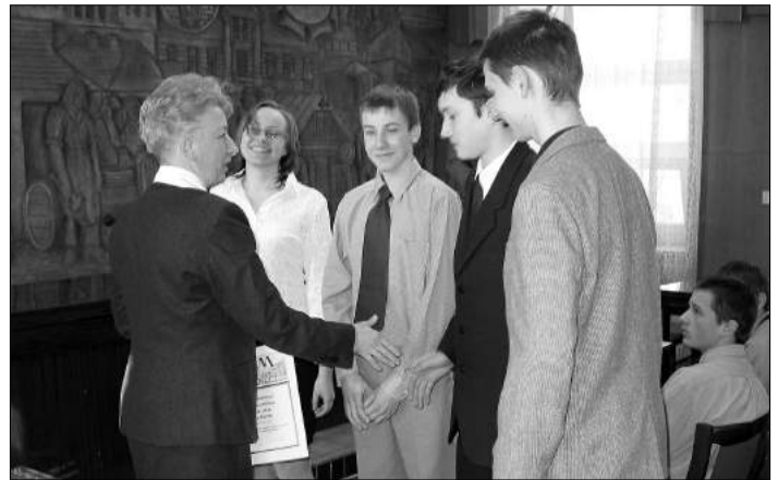
Dru yna ze S owika zaj a II miejsce

K o n k u r s przeprowadzono w kilku etapach. W pierwszym uczestnicy z o yli dwie prace pisemne, jedn opisu j c tras wakacyjnej wycieczki po Zgierzu i okolicy, w drugiej przytacza y legend zwi zan z regionem. Po ocenie prac pisemnych, kolejnym etap polega na bezpo redniej rozmowie z komisj konkursow . W trzecim etapie uczestnicy odpowiadali na pytania testowe. O zwyci stwie decydowa a og lna liczba punkt w. Uroczyste podsumowanie konkursu i wr czenie nagr d odby o si 1 kwiet-