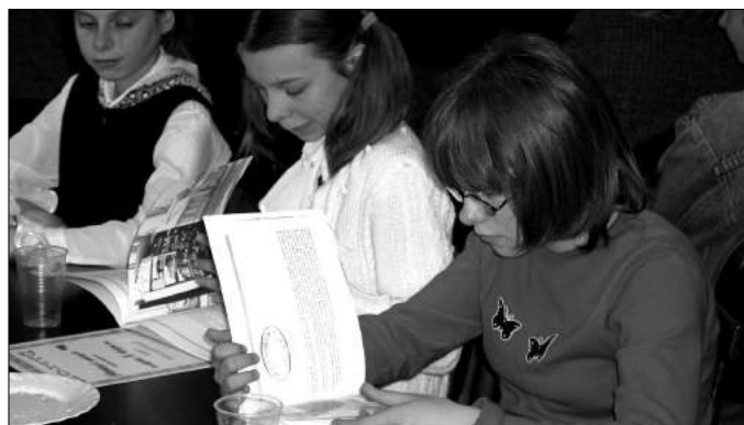
Konkurs literacki dla dzieci „Wydajemy w asn ksi k

W ramach Gminnego O rodka Kultury funkcjonuje O rodek