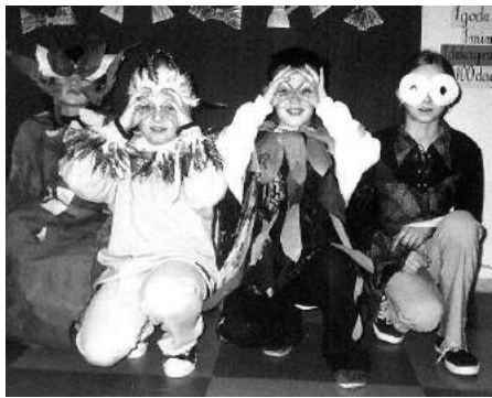
Zdjęcie z przedstawienia „Prawo jazdy”

Dzieci zaprezentowały się w przedstawieniu „Prawo jazdy” opowiadającym o przygodach młodych i starych czarownic. W spektaklu wystąpiła jedna czwórka uczniów z klas II, III i V. Mających