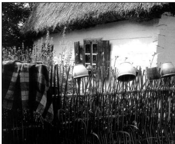
Wierzono, że wiejska chałupa ma swojego ducha

Nie bez znaczenia pozostawał dzień w którym rozpoczynano budowę .