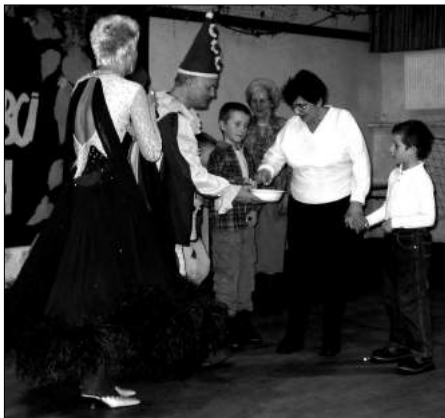
Dziadkowie wspólnie z wnuczkami nie brali udziału w konkursach

Jak co roku i tym razem Gminny Ośrodek Kultury pamięta o Dniu Babci i Dziadka. 25 stycznia 2004r. obchodzili my go w dwóch miejscach,