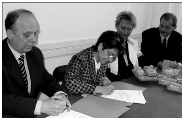
Przekazanie baterii dla szpitala

Obliczono, że 1000 sztuk ofiarowanych szpitalowi baterii alkalicznych oraz dwie nowoczesne ładowarki