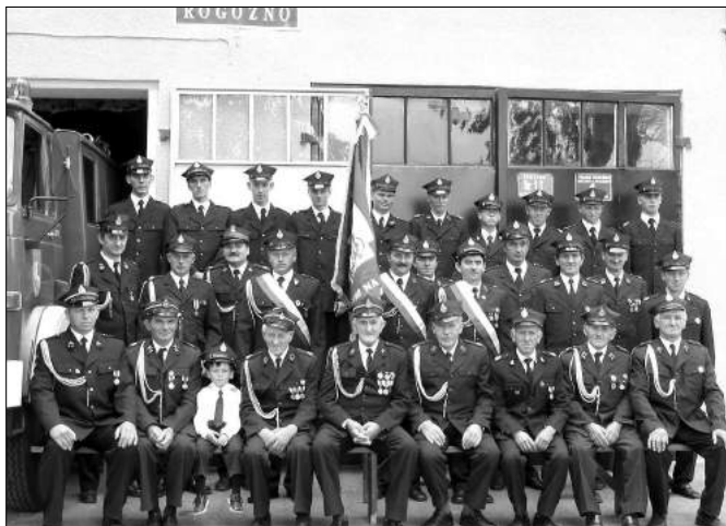
Jubileusz 90 - lecia jednostki OSP z Rogoźna

W 2003 roku Ochotnicza Straż Pożarna w Kaniej Górze wzięła udział w Powiatowych Zawodach Pożarniczych, w których zajęła VI miejsce. W pierwszym półroczu 2003 roku