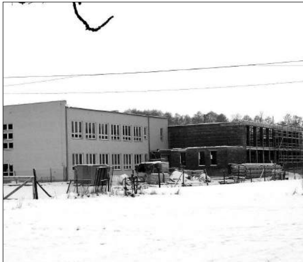
Rozbudowa szko y w Szczawianie

budowy w Zespole Szkolno - Gimnazjalnym w Szczawianie. Powstaje nowoczesna sala gimnastyczna, dla kt rej dofinansowanie w latach 2003 - 2005, w kwocie 800 tys. z , gmina otrzyma z Ministerstwa Edukacji Narodowej i Sportu. W maju zako czona zosta a