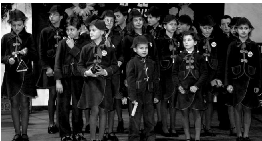
W Słowiku dla Babci i Dziadków wystąpiła schola Kolorowe Laurki