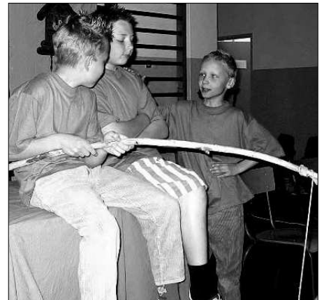
Zdj cia na stronie pochodz z nagrodzonego przedstawienia

gadanie opowiada o dorastaniu i nauce w smoczej szkole. Jest dosko-