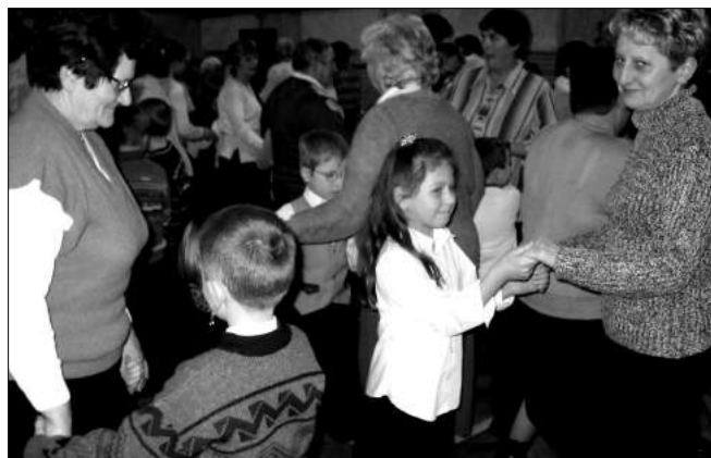
Przygotowana impreza to okazja do wspólnej zabawy