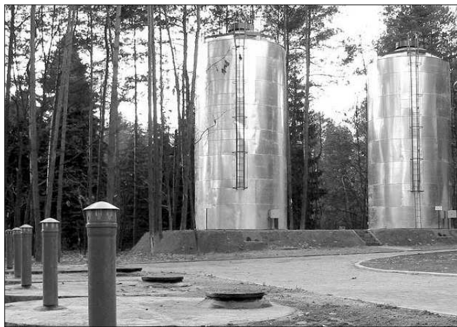
Du inwestycj zako czon w 2003 r. by o zadanie pn. Rozbudowa stacji wodoci gowej w Ustroniu"

rodki Funduszu Ochrony Grunt w Rolnych w kwocie 120 tys. z dofinansowa y remont dr g dojazdowych do grunt w rolnych. I tak odnowiono t uczniem nawierzchni