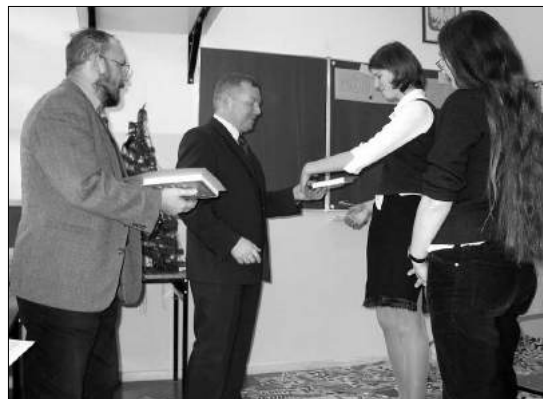
Na koniec warsztatów w rozstrzygnięciu zostały konkursy i wręczono nagrody