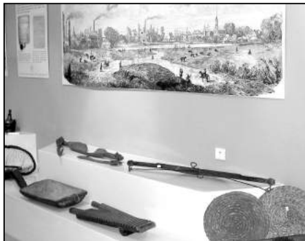
Od niedawna mo na oglądamo ekspozycję Dzieje Zgierza

ptasznika, karaczana, modliszki i patyczak w. Najmniejszych owadów przedstawicielemo na obejrzeć pod