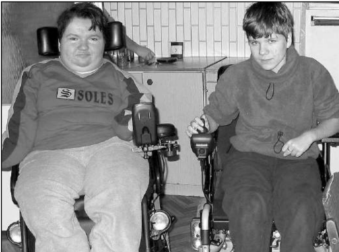
W zki daj dziewczynom wi ksz samodzielno

Z szansy tej skorzysta a jedna z rodzin naszej gminy, kt ra wychowuje