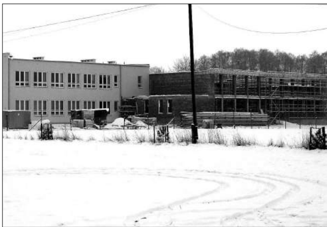
Trwa rozbudowa szko y w Szczawinie

W roku 2003 w Ustroniu zako czona zosta a inwestycja pn. Rozbudowa stacji wodoci gowej w Ustroniu . Jest to pierwsze zadanie na terenie gminy Zgierz zrealizowane przy udziale rodka w z Unii Europejskiej, w ramach przedakcesyjnego programu SAPARD. Og lny koszt inwestycji zamkn si kwot oko o 820 tys. z. z czego 372 tys. z zostanie sfinansowane ze rodka w unijnych. Oznacza to, e o tak kwot mniej gmina Zgierz wyda ze swojego bud etu na t inwestycj .