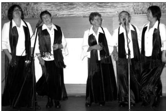
Ko o Gospody ze Szczawina

zespo u ludowego, kt ry istnieje od 2000 r. Obecnie w Szczawiniakach