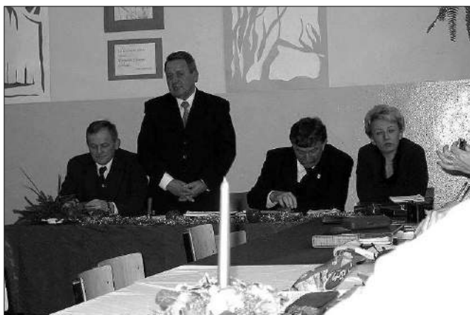
Sesja op atkowa odby a si w szkole w Grotnikach

Sp ka Wodoci gi i kanalizacja - Zgierz" zaopatruje w wod odbiorc w z terenu gminy Zgierz w D br wce Wlk. w obszarze ulic: Ciosnowska, Kasztanowa, D browska. Jak wynika o z przygotowa nych dokument w sp ka jest w a ci cielem sieci wodoci gowej o d . ok.