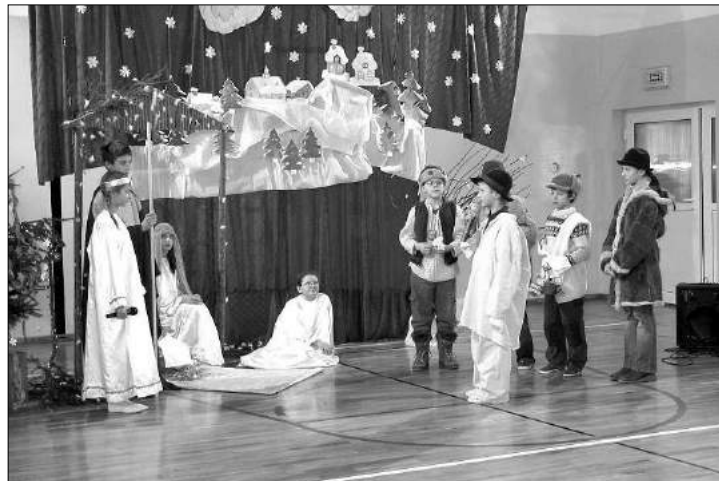
Uczestnicy sesji i go cie obejrzeni jase ka w wykonaniu dzieci z Ko a Misyjnego w Grotnikach

Po zako czeniu oficjalnej cz ci, radni oraz zaproszeni go cie przeszli na sal gimnastyczn , gdzie w wi tecz-