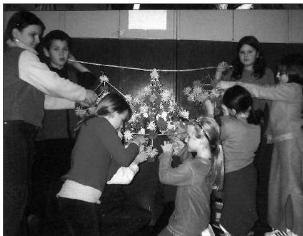
Przygotowanie paj ka - tradycyjnej ozdoby wiejskiej chaty

machem scenograficznym. W grudniu szkolna widownia oraz rodzice doskonale bawili si ledz c przygody m odych i starych czarownic w inscenizacji Prawo jazdy . Kolejna propozycja na zagospodarowanie czasu wolnego to