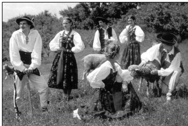
Strój górali żywieckich

Strój wiejski nie tylko ozdobił, na podstawie ubioru można było określić zamieszkiwanie, stan społeczny, a nawet miejsce zamieszkania ze