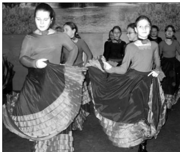
Zespo Wariacja prezentuje si w ta cu wsp czesnym