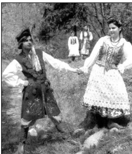
Strój krakowski zyskał znaczenie stroju narodowego

Stroje które dziś możemy oglądać podczas występów w zespołach ludowych lub w muzeach etnograficznych były niegdyś odwrotnymi ubiorami chłopskimi, strojnymi, zdobionymi, od których różniły się prostymi ubiorami