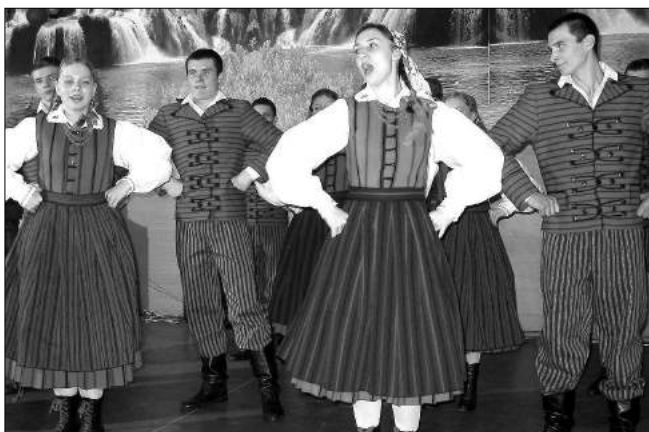
Szczawiniacy w strojach czyckich

Wyst py sta y si okazj do prezentacji nowych stroj w Szczawiniak w , sp