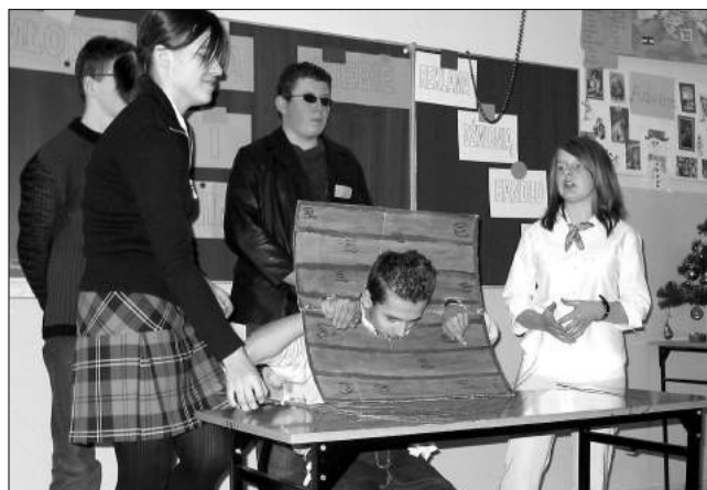
Gimnazjaliści z Giecznie w przedstawieniu zaprezentowanym na zakończenie programu

ecznymi. Była to również okazja do przedstawienia potrzeb i oczekiwań młodzieży i jednocześnie poznania stanowiska drugiej strony.