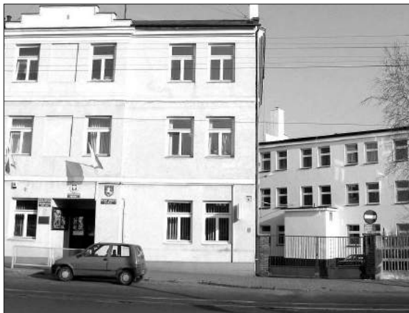
Zakończył się remont budynku Urzędu Gminy

Prace modernizacyjne obejmowały między innymi zainstalowanie nowoczesnego, bezobsługowego kotła gazowego, który zastąpił dwa stare, wymianę instalacji centralnego ogrzewania, a także wymianę okien i docieplenie całego budynku w