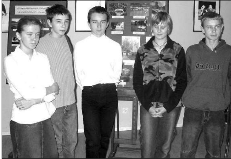
Laureaci konkursu ze szkoły w Szczawinie