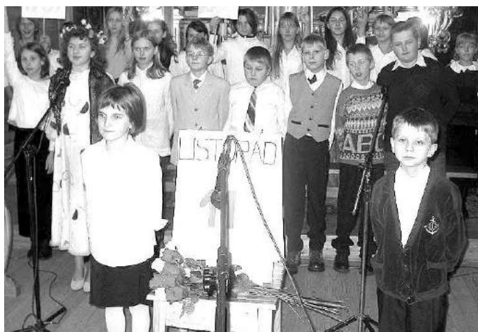
Program patriotyczny przedstawili dzieci z SP w Białej