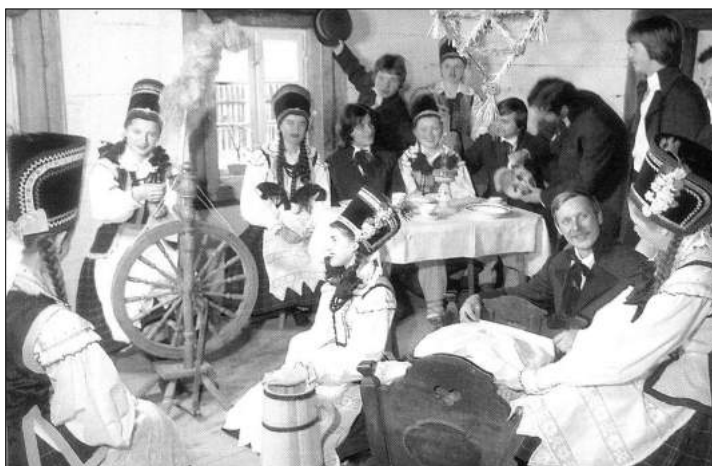
Staropolskie wróbnym gromadziły dziewczęta i chłopcy

Poznawano też przyszłość w druc powoli wzdłuż potu i licząc kolejne sztachety. Jeżeli byłaby ich liczba parzysta, dziewczyna miała rychło znaleźć męża, w przeciwnym