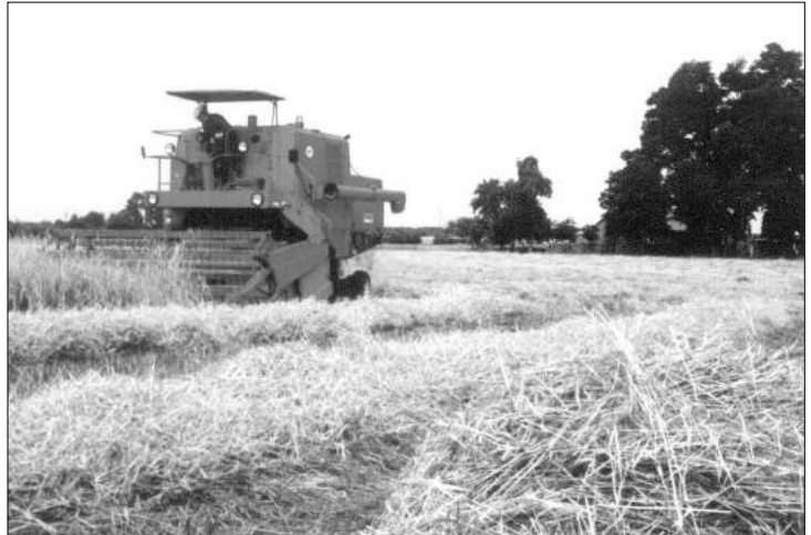
Dotowana będzie uprawa zbóż

która odbywa się w tym czasie corocznie w lipcu i sierpniu, objętych zostanie 10% gospodarstw rolnych w Polsce. Podczas kontroli urzędnicy sprawdzą, czy działka, w stosunku do której złożono wniosek o dopłatę, istnieje, czy dane dotyczące działek ewidencyjnych są zgodne z danymi zawartymi w rejestrze gruntów prowadzonym przez starostwa powiatowe; czy powierzchnia działek rolnych nie jest większa niż powierzchnia działek ewidencyjnych; czy na danej działce rolniczo jest tylko jeden wniosek. Urzędnicy sprawdzą również zgodność danych we wniosku ze stanem faktycznym. W ramach kontroli na miejscu (czyli w danym gospodarstwie) sprawdzą, gdzie się znajduje powierzchnia działki rolnej zadeklarowanej przez wnioskodawcę, czy jest zgodna z rzeczywistą powierzchnią tej działki; czy zadeklarowane grunty są utrzymywane w dobrej kulturze rolnej; jakie jest faktyczne przeznaczenie działki; gatunek i odmian uprawianej rośliny.