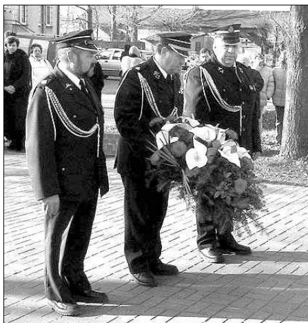
Kwiaty przed pomnikiem żołnierzy przedstawiciele OSP

Za kościołem znajduje się grób powstańców z 1863r. Na cmentarzu w zbiorowej mogile spoczywają żołnierze polegli podczas II wojny światowej. Tablica na cmentarzu upamiętnia mieszkańców wsi zamordowanych przez hitlerowców.