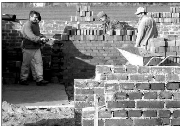
Rozpoczyna się kolejny etap rozbudowy szkoły w Szczawinie

Aktualnie modyfikacja Szczawina dowodzi, że jest do zrobienia, aby mogła odbywać się zajęcia w sali gimnastycznej. Jest to bardzo duży wysiłek organizacyjny, a co naj-