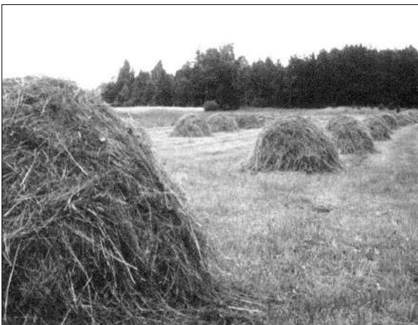
Dopłaty przysługują do karmienia i pastwisk

Nie zwalnia to jednak posiadaczy zwierząt z obowiązku ich znakowania i prowadzenia dokumentacji w ramach Systemu Identyfikacji i Rejestracji Zwierząt.