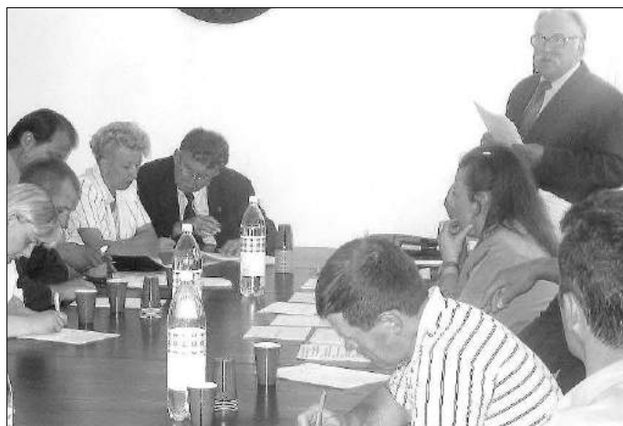
Z przebiegiem szlaku zapoznali się właściciele gospodarstw, restauracji i sklepów, które w przyszłości połączą projekt

Szlak będzie przebiegał przez miejscowości: Dąbrówka Wielka, Rosanów, Ciosny, Dzierżązna, Swoboda, Kolonia Głowa, Biała, Jeżewo. Atrakcje jakie czekają na turystów to, obok możliwości odwiedzenia i wypoczynku w poszczególnych gospodarstwach agroturystycznych, między innymi: rezerwat jałowców, źródła rzeki Ciosenki w Rosanowie, młyn i tartak w Ciosnach, Stara Kuźnia, cmentarz z 1914r. oraz obelisk obok starej szkoły w Dzierżąnej. Jadąc dalej można będzie zajrzeć do fermy strusi w Swobodzie. Natomiast w Białej zwiedzić Izbę Pamięci poświęconą obozowi dla małych dzieci podczas II wojny światowej w Dworcu w Dzierżąnej. Przedstawiono także propozycje graficzne znaków informacyjnych jakie zostaną umieszczone na trasie przyszłego szlaku.