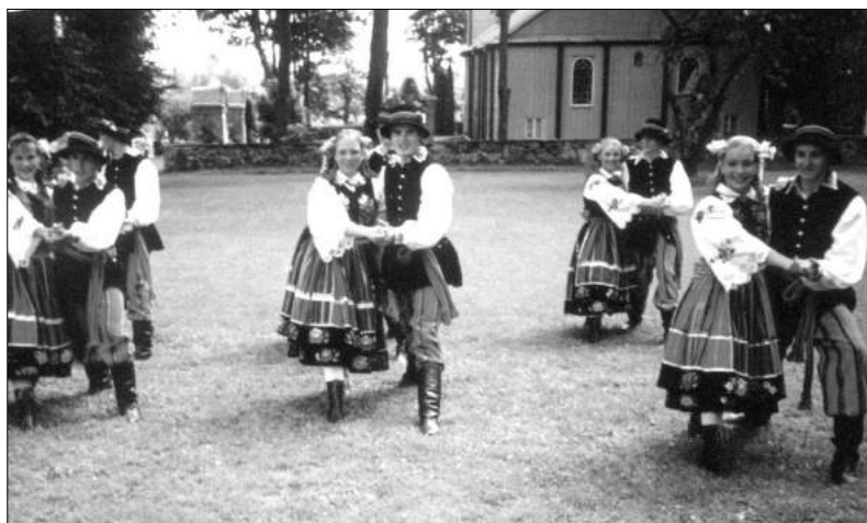
Zespół Szczawiniacy jako jeden z niewielu występujących na scenie zaprezentował się w tańcach ludowych.

Wójt oraz Rada Gminy Zgierz zapraszają na DO WYBÓRÓW 2003 O rodek Szkoleniowo - Wypoczynkowy w Dzierżnej 24 sierpnia 2003r.