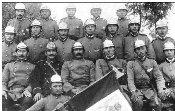
Założyciele OSP w Rogonice. Zdjęcie z 1913r.

Obecnie w jednostce w Rogonice służy 38 czynnych strażaków, którzy uczestniczą we wszelkiego rodzaju ak-