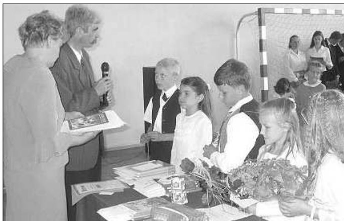
Najlepsi otrzymują nagrody i wyróżnienia podczas uroczystego apelu na zakończenie roku szkolnego