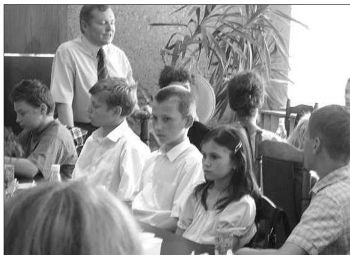
Jak co roku w sali konferencyjnej UG spotkali się najlepsi uczniowie