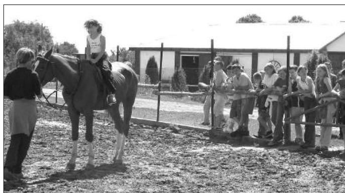
W gospodarstwie Państwa Staćczak w

W tym czasie uczestnicy programu przejechali na rowerach około 180 km, odwiedzając wiele miejsc na przyszłym szlaku turystycznym. Każdy dzień przynosił inne zajęcia ale także konkretną pracę do wykonania. Obowiązkiem dzieci było wypełnienie tak zwanej karty pracy, w której opisywały kolejne punkty trasy. Jeżeli było to na przykład gospodarstwo agroturystyczne to podczas wywiadu z właścicielem, pytały o liczbę miejsc noclegowych, standard pokoi, wyżywienie a także dodatkowe atrakcje i możliwość korzystania z różnych form rekreacji. Jeżeli był to bar, pub lub sklep pytały o godziny pracy, jakie potrawy można zjeść, czy i jaki asortyment posiada dany sklep. Dzięki tym notatkom powstał wyczerpujący materiał stanowiący, niezbędny dla turystów, opis trasy, który w przyszłości