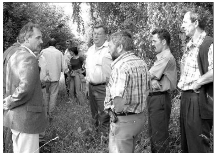
Radni zapoznali się m. in. ze stanem drzewostanu na gruntach komunalnych w miejscowości Kwilno

Na zakończenie części wyjazdowej Komisja zlustrowała teren pod budowę oczyszczalni ścieków w Lućmierzu. W miejscu powstania oczyszczalni dokonano już odwiertów i zbadano poziom wód gruntowych. Ekspertyzy potwierdziły możliwość budowy na wyznaczonym terenie obiektu oczyszczalni w systemie studni chłonnych. Trwają również prace związane z przygotowaniem dokumentacji