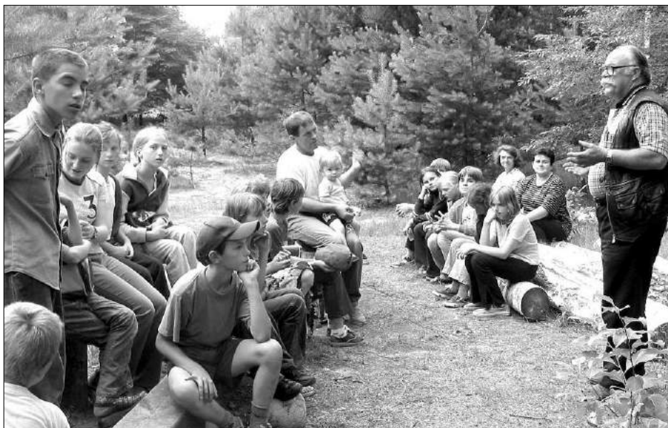
Grupa dzieci z SP w Białej uczestniczą w programie Wakacje z agroturystyk

Pożegnalne ognisko odbyło się 15 lipca, było okazją do podsumowania wykonanej pracy. Uczestnicy byli bardzo rozżaleni, że kończy się wspaniały czas