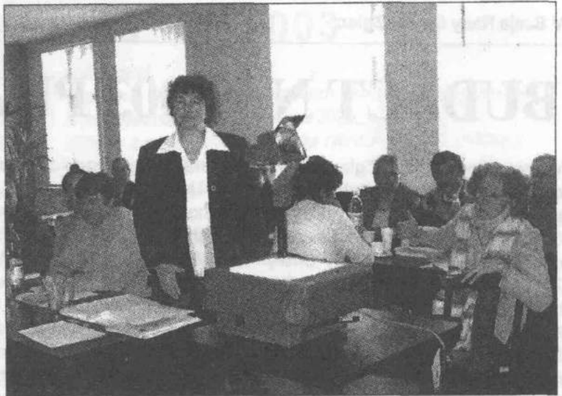
Przedstawicielki WODR odpowiadały na pytania związane z wymogami wobec polskiego rolnictwa w Unii Europejskiej

Zalesianie gruntów – wsparcie obejmuje: dotację na zalesienie, która pokrywa koszty założenia uprawy