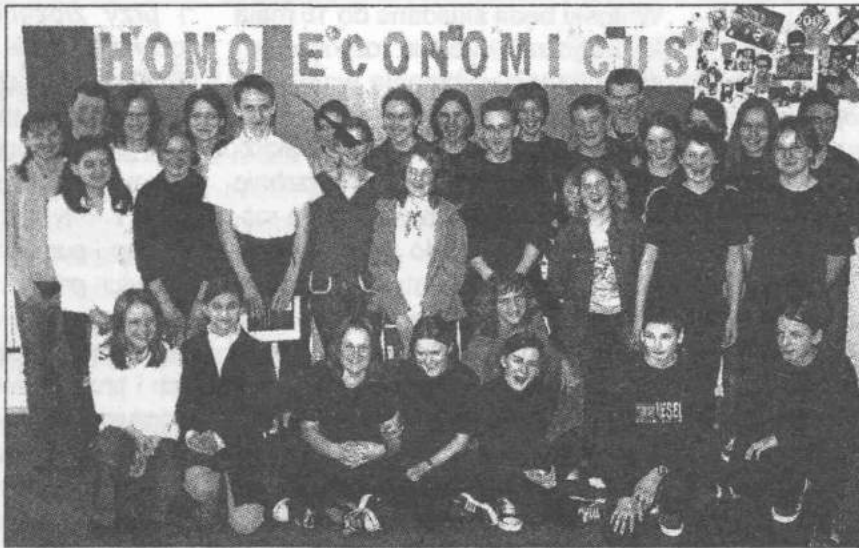
Wspólne zdjęcie na zakończenie programu

duszy pomocowych. W ramach zajęć młodzież brała udział w konkursie wiedzy, przygo-