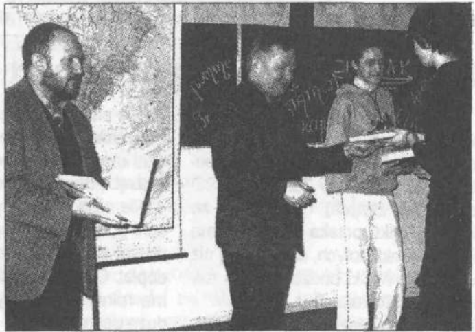
Najlepsi otrzymali nagrody

nie zaprezentować w czasie rozmowy kwalifikacyjnej. Poznawali wymagania związane z zakładaniem własnej firmy, pisanie biznesplanu, organizacją pracy i określaniem kosztów produkcji, czyli co robić, żeby zarobić i dać zarobić innym. Uczyli się zasad gospodarki wolnorynkowej oraz jak korzystać z unijnych fun-