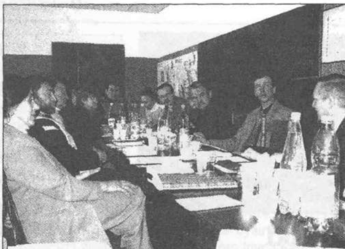
Komisja złożyła wniosek o przeprowadzenie szkoleń dla przedsiębiorców oraz sprzedawców napojów alkoholowych.

Do zadań Komisji należy również udzielanie rodzinom, w których występują problemy alkoholowe, pomocy psychospołecznej i prawnej. Również zwiększenie dostępności pomocy terapeutycznej i rehabilitacyjnej dla osób uzależnionych od alkoholu. W ramach pomocy terapeutycznej na terenie gminy Zgierz działa punkt konsultacyjny, w którym można skorzystać z porad psychologa.