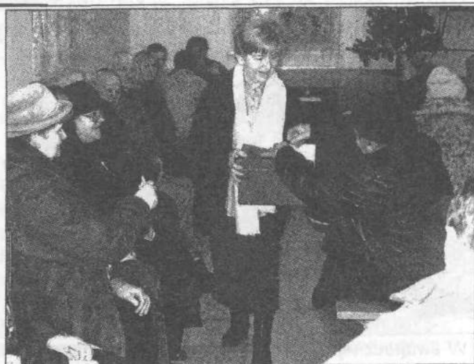
Wybory zostały przeprowadzone w sposób bezpośredni i tajny

wybieranie i odwoływanie sołtysa i rady sołeckiej, rozpatry-