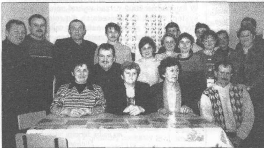
Rodzice i pracownicy SP w Dąbrówce zaangażowani w remont

Rada Pedagogiczna i Samorząd Szkolny składają serdeczne podziękowanie rodzicom i pracownikom