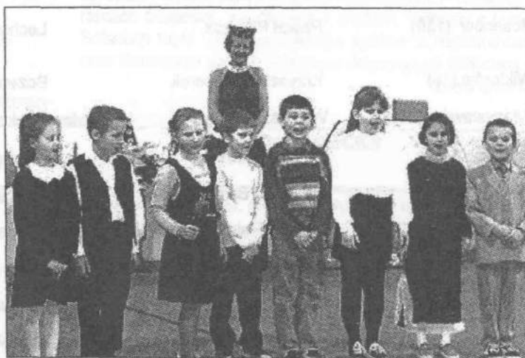
Najlepsze życzenia dla Babć i Dziadków składali najmłodszy