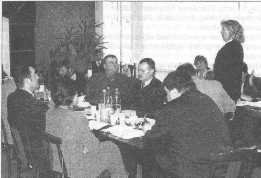
Radni zdecydowali, że GOK zostanie przeniesiony z Białej do Dzierżąznej

Znaczna część podjętych podczas ostatniej sesji uchwał dotyczyła sprzedaży działek. W drodze przetargu przeznaczono do sprzedaży działki w Jedliczu B, Ustroniu i Rosanowie.