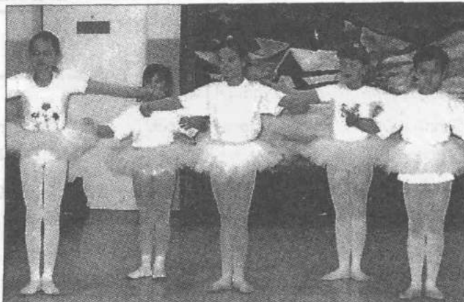
W SP w Dąbrówce reaktywano dziecięcy zespół Milenium

Szkoła nie zawiodła także amatorów filmu. Dzieci obejrzały w łódzkim kinie przebój kinowy – Harrego Pottera i Komnatę Tajemnic. Młodzież klasy V uczestniczyła w biwaku. Biwak rozpoczął się ogniskiem pod gwiazdami i pieczeniem kiełbasek. Zabawę na