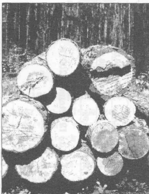
Wycinanie drzew wymaga zezwolenia

9. usuwanych z terenów zieleni miejskiej, parków ustanowionych przez radę gminy, z ogrodów dział-