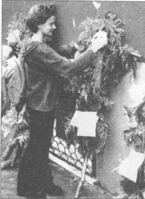
Ostatnie poprawki przed ogłoszeniem werdyktu

Zadaniem specjalnym było przygotowanie podczas marszu kukły z traw i darów lasu. Po dotarciu na metę w Szkole Podstawowej w Grotnikach, dzięki grochówce przygotowanej przez gościnną szkołę, uczestnicy nabrali sił do kolejnych konkurencji, tym razem