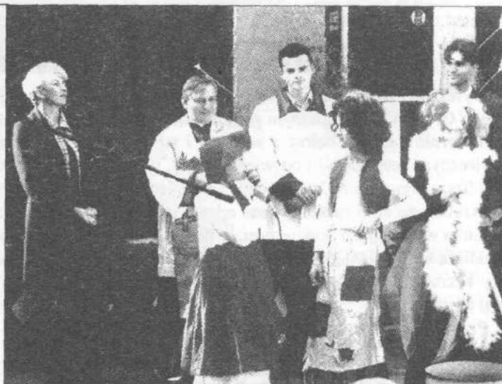
Goście obejrzeli występy teatryku „Śmiechotek”

Zapraszając do korzystania z nowego Punktu Kasowego i życząc zadowolenia z korzystania z usług Banku