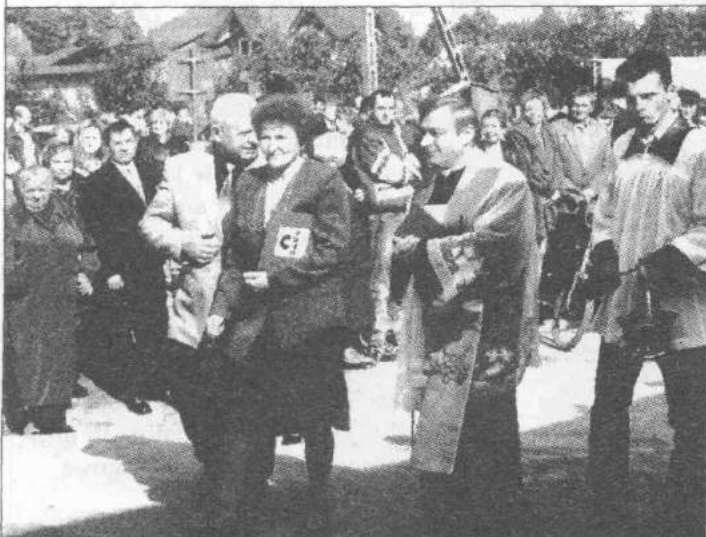
Otwarcu filii banku towarzyszyli licznie zgromadzeni przyszli klienci

Szczawinianie powitali nowego członka swojej społeczności bochnem chleba, po czym wszyscy zgromadzeni i przyszli klienci mogli obejrzeć nowy Punkt Kasowy Banku (otwarty dla interesantów już w poniedziałek następnego dnia). Po oficjalnych uroczystościach, uczestnicy z towarzyszeniem orkiestry przeszli do Karczmy Szczawińskiej, która tym razem w barwach Banku Spółdzielczego w Zgierzu serwowała chleb ze smalcem i ogórki.