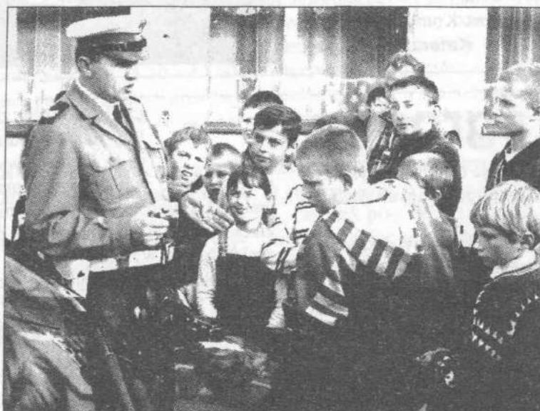
Dzieci mogły przyjrzeć się przedmiotom, które służą policjantom w codziennej pracy