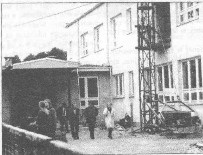
Teren budowy szkoły w Szczawinie