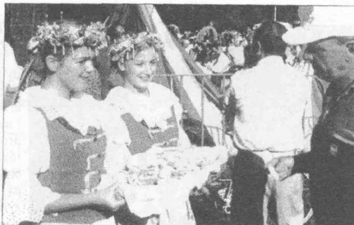
Doroczne dożynki w Dzierżąznej

pejskiej. Rozwijając ten kierunek współpracy gmina Zgierz będzie miała nowe możliwości wymiany