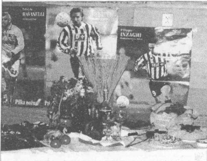
Na stoisku włoskim...

Członkowie Klubów Europejskich z Gimnazjów w Szczawinie i Giecznie