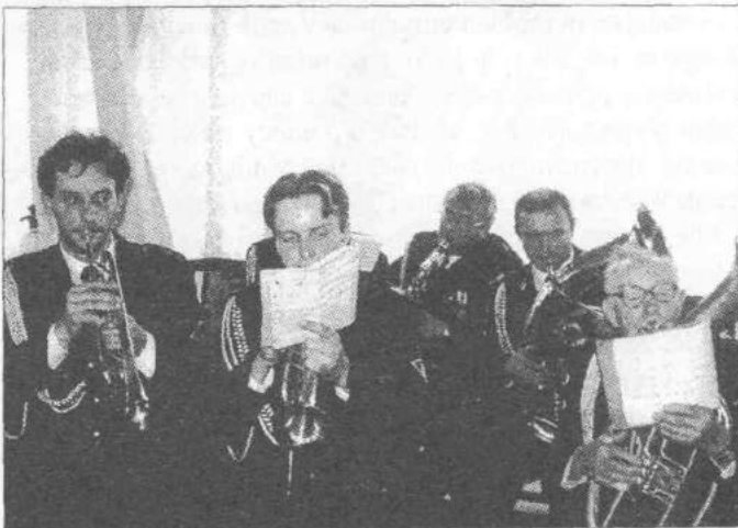
Koncert orkiestry dętej ze Szczawina

W czasie obrad podjęto uchwałę programową, ustalając główne kierunki działania m.in.: podejmowanie działań w zakresie podnoszenia sprawności operacyjno-technicznej OSP, doskonalenie pracy z młodzieżą w celu pozyskania przyszłych członków.