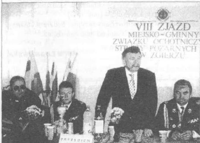
Dyskutowano o bieżących problemach

W bieżącym roku jednostki z Białej i Grotnik będą obchodzić jubileusze 35-cio i 80-cio lecia. Jednak najstarszą w gminie jest jednostka z Rogóźna, która liczy ponad 90 lat.