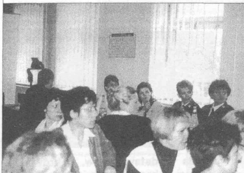
Podczas konferencji w gminie

wego Centrum Pomocy Rodzinie, Poradni Psychologiczno-Pedagogicznej, Ośrodka Wspierania Rodziny w Zgierzu, Gminnego Ośrodka Pomocy Społecznej, dyrektorzy szkół podstawowych, gimnazjów i domów dziecka.