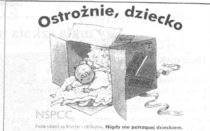
Plakat, który towarzyszył ogólnopolskiej kampanii

Obecni byli również przedstawiciele instytucji współpracujących z gminą w zakresie udzielania pomocy dzieciom krzywdzonym, funkcjonariusze Komendy Powiatowej Policji w Zgierzu, Sędzia i Kurator Sądu Rejonowego III Wydziału Rodzinnego i Nieletnich, pracownicy Powiato-