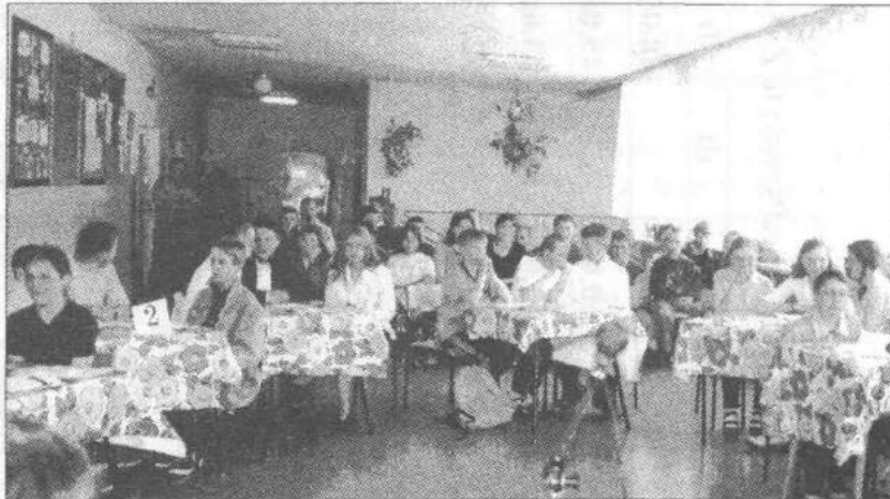
III Konkurs Historyczny (wyniki współzawodnictwa na str.16)