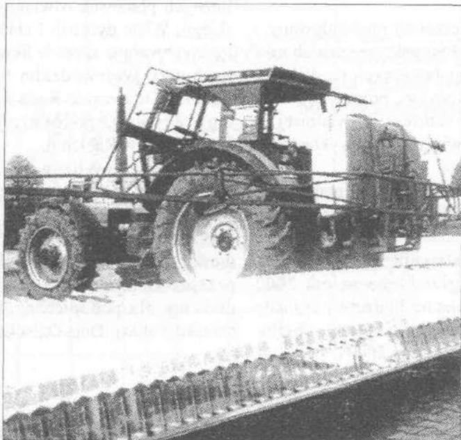
Badaniom podlegają opryskiwacze

Odpłatność za dokonanie usługi przeglądu opryskiwacza, uzależniona jest od szerokości roboczej belki opryskiwacza i po odliczeniu dotacji z budżetu państwa przeznaczonej na obniżenie posiadaczom sprzętu kosztów badań, w Przedsiębiorstwie „AGROMA” w Łodzi wynosi: przy szerokości roboczej belki opryskiwacza 8 m - odpłatność 33,94 zł. , przy szer. 10 m odpłatność - 57,10 zł. przy szer. 12 m - odpłatność 80,30 zł. , przy szer. 18 m - odpłatność 141,06 zł. , opryskiwacz sadowniczy - odpłatność 60,00 zł