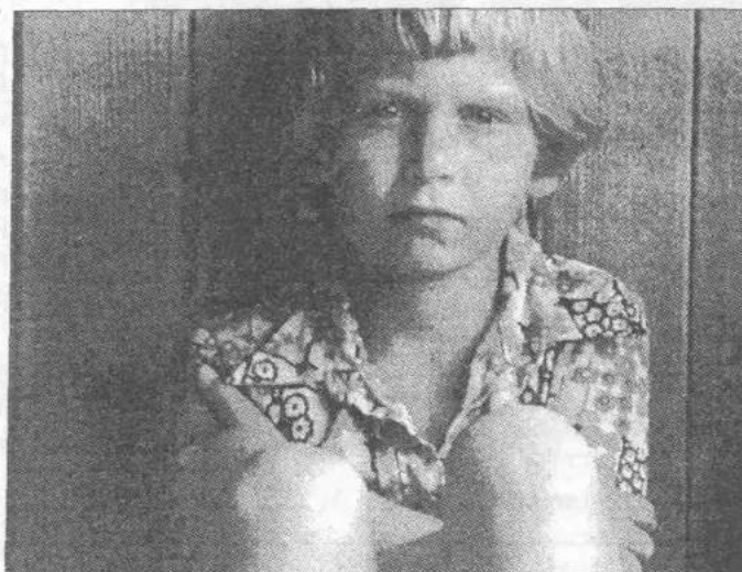
Dzieci są najbardziej pokrzywdzone

Gminny Ośrodek Kultury w Białej zaprasza dzieci i młodzież (od 9 do 18 lat) na letni wypoczynek „Kołobrzeg i okolice” w terminie 27.06-10.07.2001r