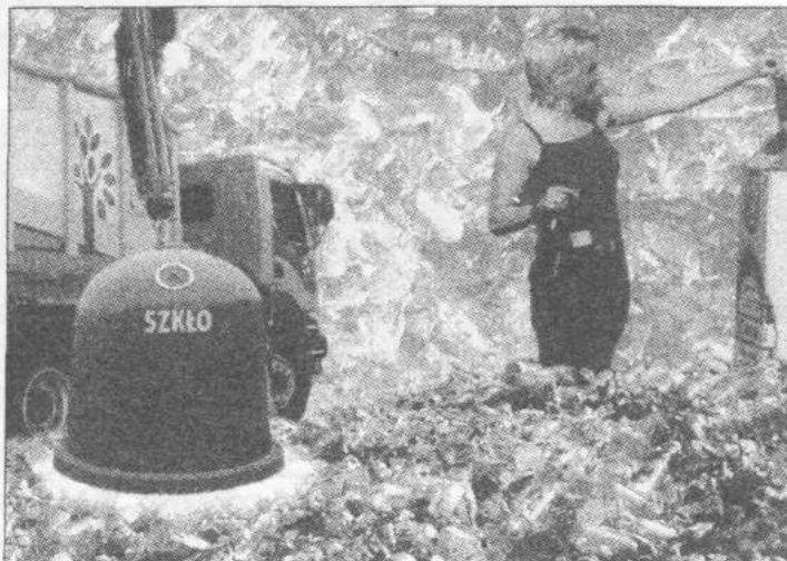
Warto zbierać stłuczkę szklaną, żeby przetwarzać ją na szkło

tworzonej (czyli poddanej recyklingowi) tony szkła można wyprodukować tonę „nowego”. „Stare” szkło jest bardziej wydajne niż surowce używane do jego wytworzenia. Trudnością pozostaje zebranie, przesortowanie i dostarczenie do producentów pojemników szklanych wystar-