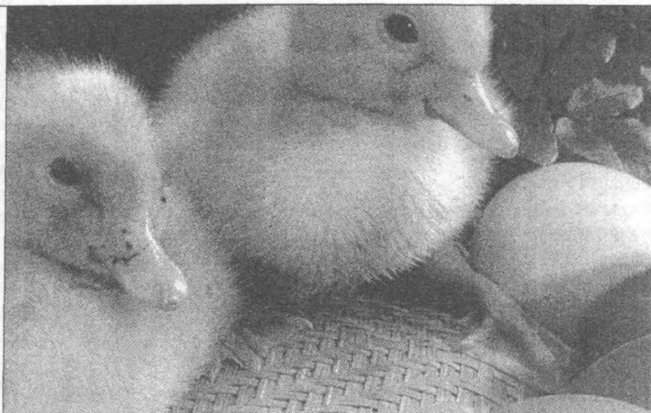
Jajko i kurczęta symbolizują nowe życie

Przygotowanie świątecznej kulminacji rozpoczynało się od Wielkiego Tygodnia, którego początek wyznaczała Kwietna czyli Palmowa Nie-