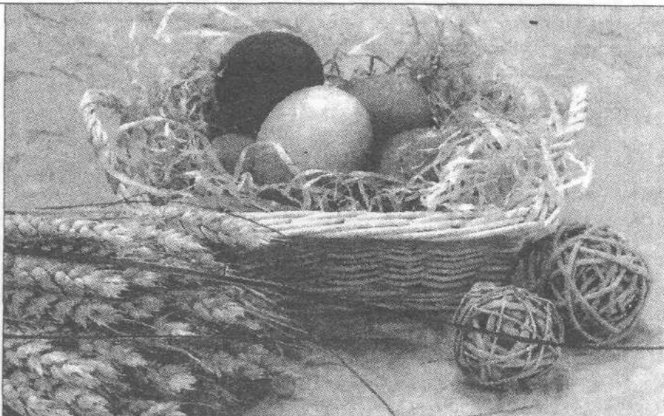
Pisanki poza urodą mają ważny sens symboliczny

Przychodząc do czyjś domu można było być obdarowanym kolorowymi jajami. Otrzymać od kogoś