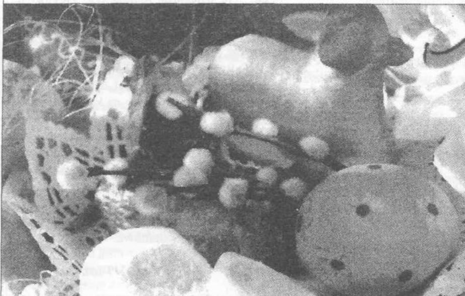
Tradycyjne elementy wielkanocnego stołu

dziela. Wymagano, by wszyscy uczestniczyli w nabożeństwie upamiętniającym wjazd Chrystusa do Jerozolimy, zapowiadającym jego rychłą śmierć i zmartwychwstanie. Święcono wówczas palmy, a pączki z nich oderwane