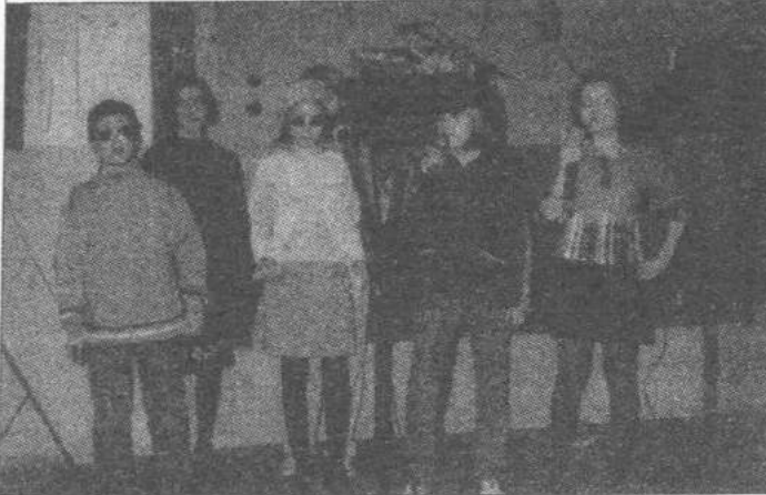
Uczniowie ze Szkoły Podstawowej nr 10

Udział wzięło około 90 pań. Po powitaniu, złożeniu życzeń i kwiatów przez przedstawicieli Zarządu Gminy oraz Miasta Zgierz, rozpoczęła się część artystyczna. Wystąpiły dzieci ze Szkoły Podst. nr 10, których występy