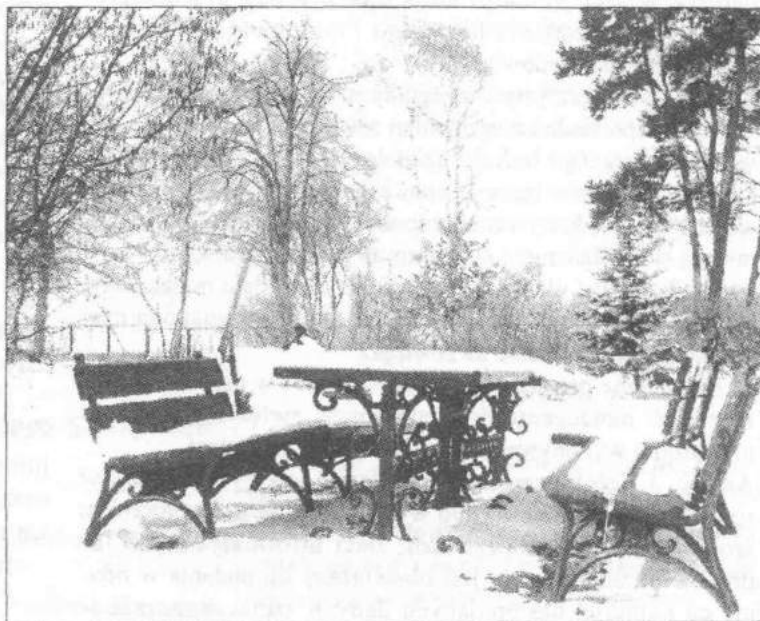
Park w Dzierżąnej w zimowej szacie