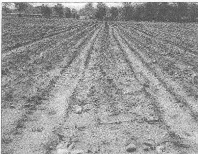
Melioracje mają wpływ na plony

GSW w stosunku rocznym opłacane były zaledwie w 10%. Przez tak niskie opłaty, brak dotacji Urzędów: Gminy i Wojewódzkiego, są małe efekty pracy w konserwacji urządzeń melioracyjnych w stosunku do dużych potrzeb. Jeżeli brak troski będzie się przedłużał, doprowadzi do całkowitej dewastacji urządzeń i obniżki plonów, a na nowe melioracje nie będzie pieniędzy.