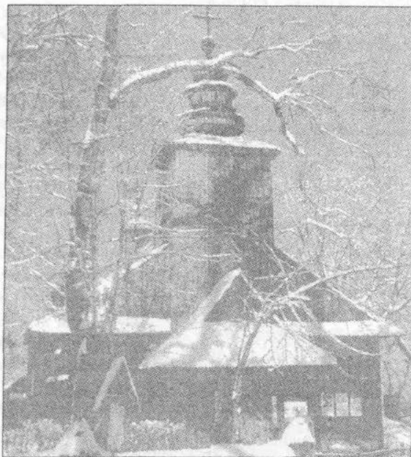
Stary Kościółek w Zakopanem.

Hotelu „Kasprowy” na Gubałówkę. W grudniu 2000 r. oddano do użytku ten jeden z najnowocześniejszych wyciągów w Europie. Z Gubałówki uczestnicy wyprawy zjechali do Zakopanego kolejką linowo-szynową. W czasie zwiedzania Zakopanego obejrzano kościoły zakopiańskie: Sanktuarium na Krzeptówkach, kaplicę według projektu Stanisława Witkiewicza na Jaszczurówce oraz nowy, piękny kościół w Zakopanem - Olczy. Dużym zainteresowaniem