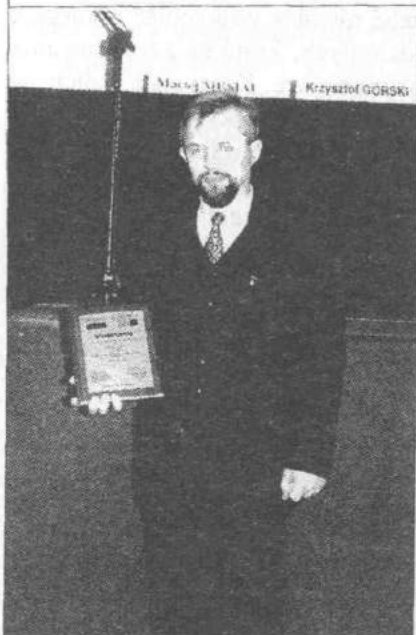
Dyplom odebrał Wójt Gminy

Za Gminny Ośrodek Szkoleniowo-Wypoczynkowy w Dzierżąnej, Gmina Zgierz otrzymała wyróżnienie w konkursie „Piękne Miejsca”, którego organizatorem byli: Międzynarodowy Magazyn Nieruchomości „Piękne Miejsca” oraz Związek Miast Polskich.