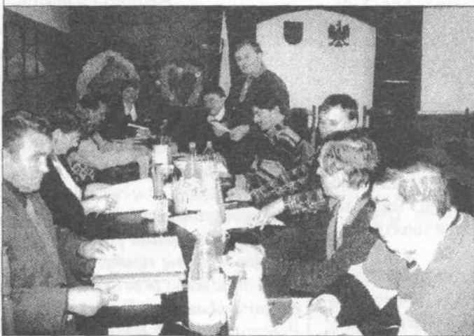
Komisje Rolnictwa i Przestrzegania Prawa Gminnego.

omówiła możliwości dofinansowania materiału siewnego dla rolników i współpracy z Agroinkubatorem w Strykowie.