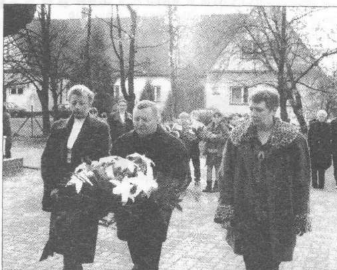
Złożone zostały kwiaty pod pomnikiem J. Piłsudskiego