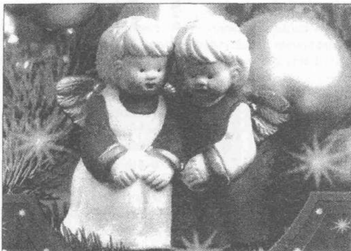
Ozdobami polskich choinek są figurki aniołów

W niektórych stronach Polski wprowadza się zwyczaj, że Dziecię Boże umieszcza się na tabernakulum nakrycie tiulem. Na pieśń wstępną: Wśród nocnej ciszy... , kapłan