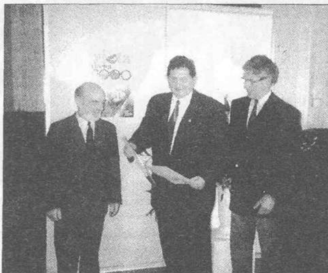
Podczas wręczenia nagrody

Dyrektor Gospodarstwa Kurii Arcybiskupiej w Szczawinie