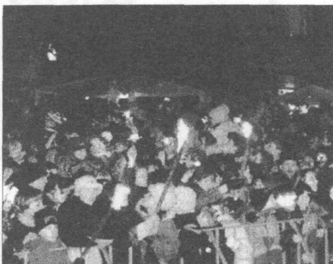
Podczas ubiegłorocznego grania na Starym Rynku

VIII Finał Wielkiej Orkiestry Świątecznej Pomocy w Zgierzu to największa impreza masowa w historii miasta. Spotkało się nas na Starym Rynku ponad 6 tysięcy osób. Nie zamierzam wymieniać wszystkiego, co było, bo nie sposób. A BYŁO NIĘZWYKLE, NIEPOWTARZALNIE.