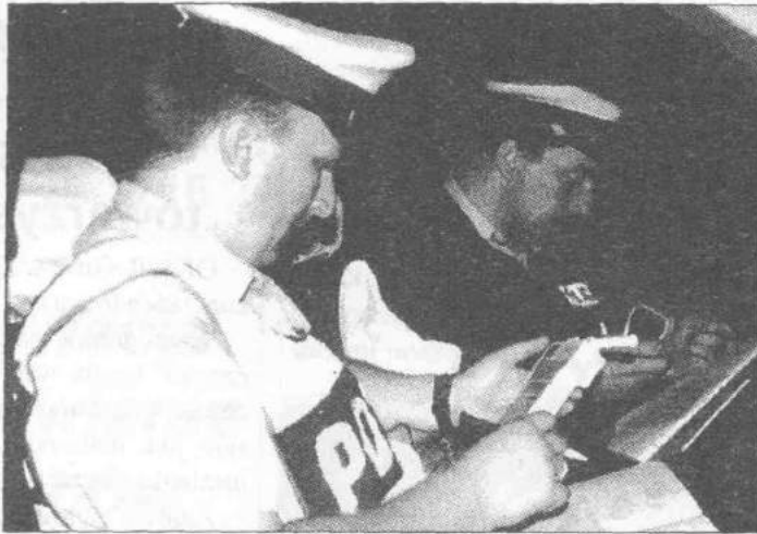
Policjanci z patrolu drogowego w czasie kontroli

Policjanci także ukarali mandatem kierowcę samochodu za przekroczenie dozwolonej prędkości i jazdę bez dokumentów. Ponadto, pouczyli kilku motocyklistów. Jeden z nich nie miał uprawnień do prowadzenia motocykla i otrzymał mandat.