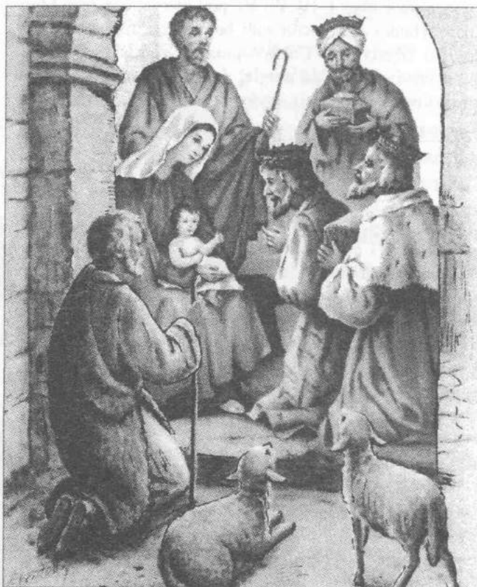
Szopka na ludowym obrazie

Tak więc wśród ludu panowało powszechne przekonanie, że Boże Narodzenie przynosi pomyślność i obfitość darów Bożej Dzieciny. Dla podkreślenia, że zwierzęta były również obecne przy Bożym Narodzeniu i spełniały swoją