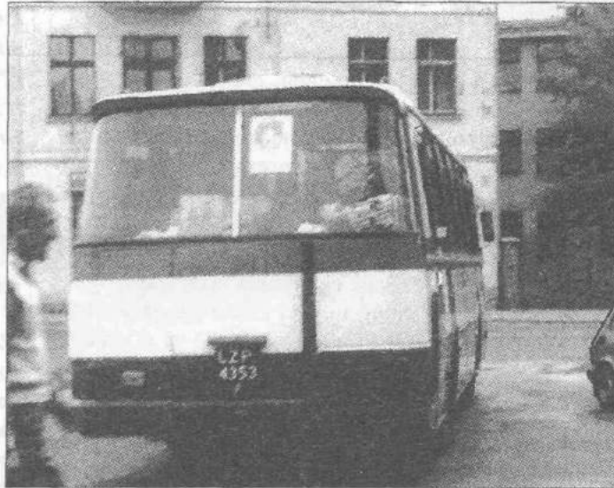
Autobus gminnej komunikacji

Szczawina do Zgierza przypomnę, że trasę tę można pokonać na dwa sposoby. Raz jadąc bezpośrednio do Zgierza. Innym razem dojeżdżając do Łągiewnik i tam przesiadając się na inną