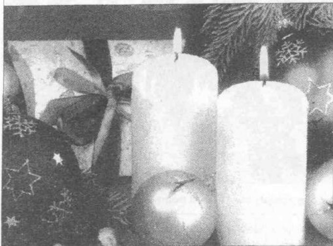
Choinka i palące się świece to stałe elementy świątecznej dekoracji

Przyjęła się w Polsce w wieku XVIII, stała się powszechną tradycją w wieku XX. Nabrała cech czegoś świętego, sakralnego, czego się nigdzie nie spotyka. Oto najpierw gospodynie urządzają generalne sprzątanie, mycie, czyszczenie. Po czterech rogach głównej sali umieszczają się