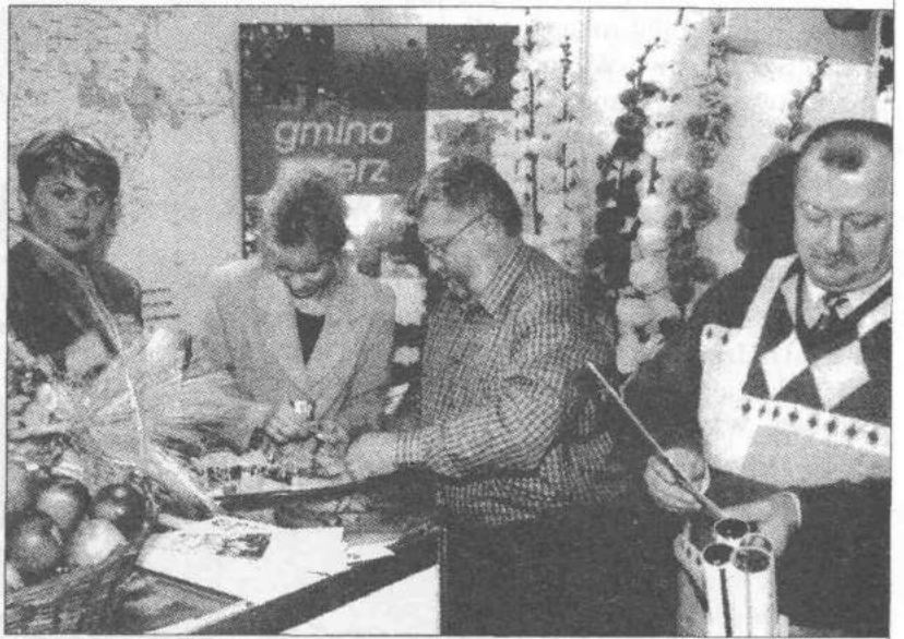
Na stoisku gminy Zgierz na II Forum

Zwiedzający interesowali się możliwością odpoczynku w gospodarstwach agroturystycznych. Swoje zainteresowanie rozwojem agroturystyki na naszym terenie potwierdzali obecni przedstawiciele Ministerstwa Gospodarki, Wojewody Łódzkiego oraz Urzędu Marszałka. Podczas konferencji na temat Strategii Województwa Łódzkiego, w części związanej z terenami wiejskimi, szczególne znaczenie zwracano na działalność agroturystyczną, ważne źródło dodatkowych dochodów gospodarstw rolnych. Jako przykład wskazywana była gmina Zgierz i działalność Sto-