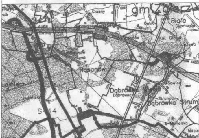
W rejonie węzłów z autostrady warto już inwestować.

Wiele czynników decyduje o atrakcyjności gminy Zgierz. Najważniejsze z nich zdecydowały o przyjęciu strategicznych obszarów rozwoju.