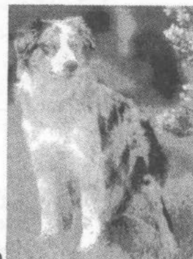
Można zabrać psa

Oferujemy wypoczynek w domkach kempingowych, murowanych, z łazienkami.