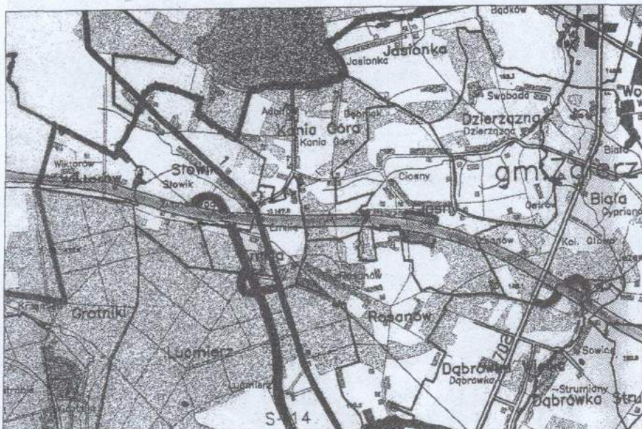
Fragment mapy gminy ze szlakami komunikacyjnymi i zjazdami z A2

O atrakcyjności gminy decyduje wiele czynników. Jednym z nich jest dobre połączenie komunikacyjne z całym krajem poprzez drogi: nr 1,702, 708, 711. W przyszłości przez teren