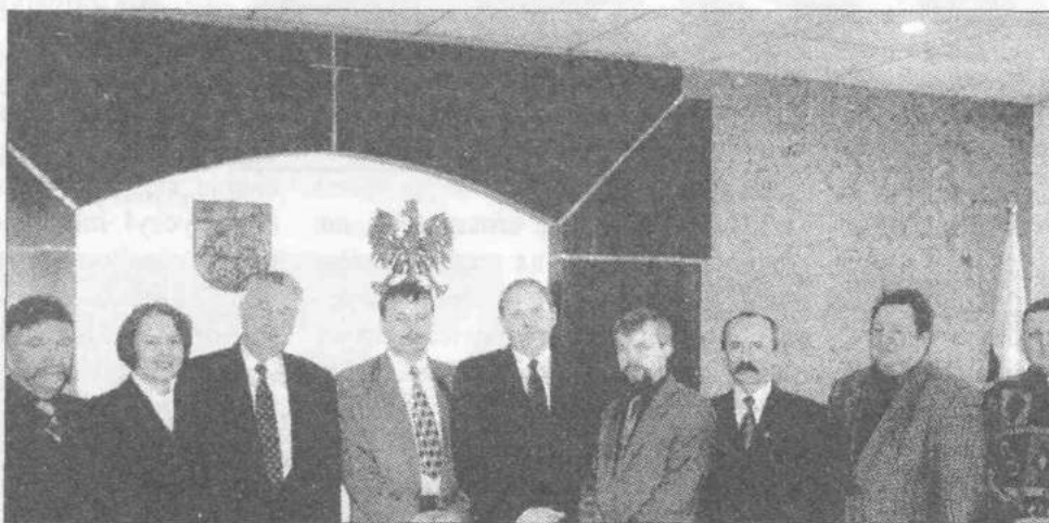
Uczestnicy spotkania - przedstawiciele obydwu gmin.