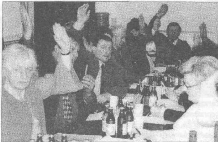
Rada Gminy Zgierz glosuje za przyjęciem uchwały w sprawie przekształcenia Szkoły Podstawowej w Słowiku.

Radni zgłosili wiele interpelacji w sprawach: poprawy bezpieczeństwa dróg w Lućmierzu i Emilii, napraw odcinków dróg w Warszycach, Kęblinach i Giecznie, ponumerowania dróg gminnych, umożliwienia mieszkańcom Słowika korzystania z drogi gminnej do Adolfova, na której bez zezwolenia wzniesiono