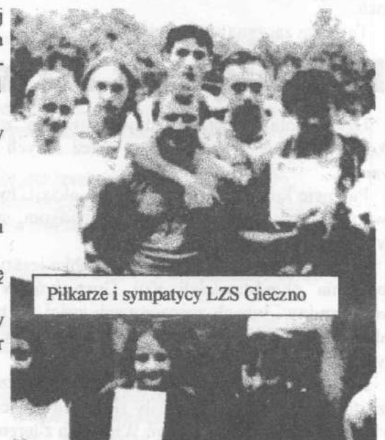
Piłkarze i sympatycy LZS Gieczno

Najlepszą okazała się drużyna Rosanowa, pokonując LZS Ciosny 3:0 i LZS Dąbrówka 5:0, i ona wywalczyła przechodni puchar przewodniczącego Ludowych Zespołów Sportowych w Zgierzu.