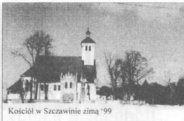
Kościół w Szczawinie zimą '99