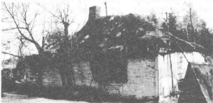
To nie najlepszy budynek na agroturystykę.

Zainteresowanie wypoczynkiem na terenie naszej gminy obserwuje