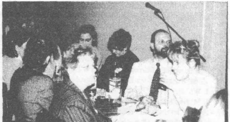
W tekście zamieszczono zdjęcia z konferencji w Grotnikach