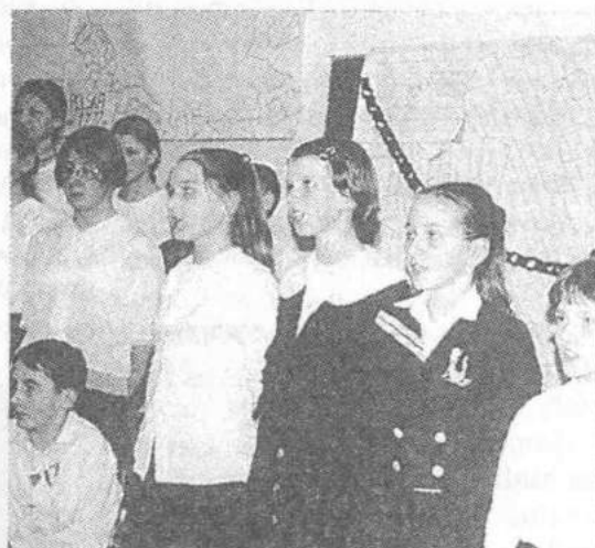
Dzieci wykonały program artystyczny.

Po zakończeniu obchodów, na zaproszenie dyrektor Szkoły Grażyny