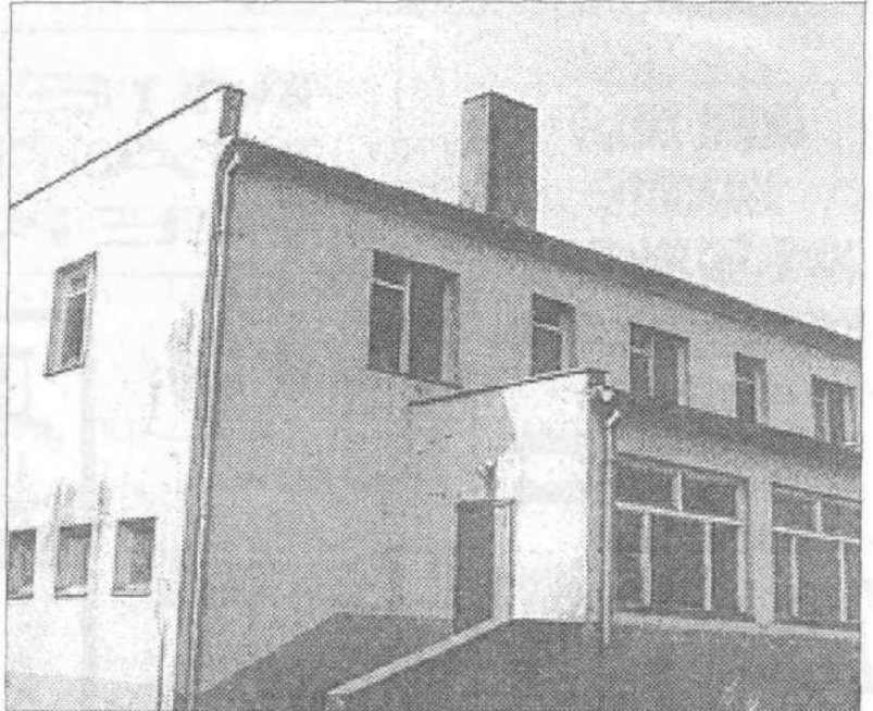
Budynek na sprzedaż po dawnej szkole w Śladkowie Górnym.

Atrakcyjne położenie na terenie słabo zaludnionym, może być dodatkowym atutem przy przeznaczeniu nieruchomości na ośrodek rehabilitacyjny, wypoczynkowy lub działalność wytwórczą.