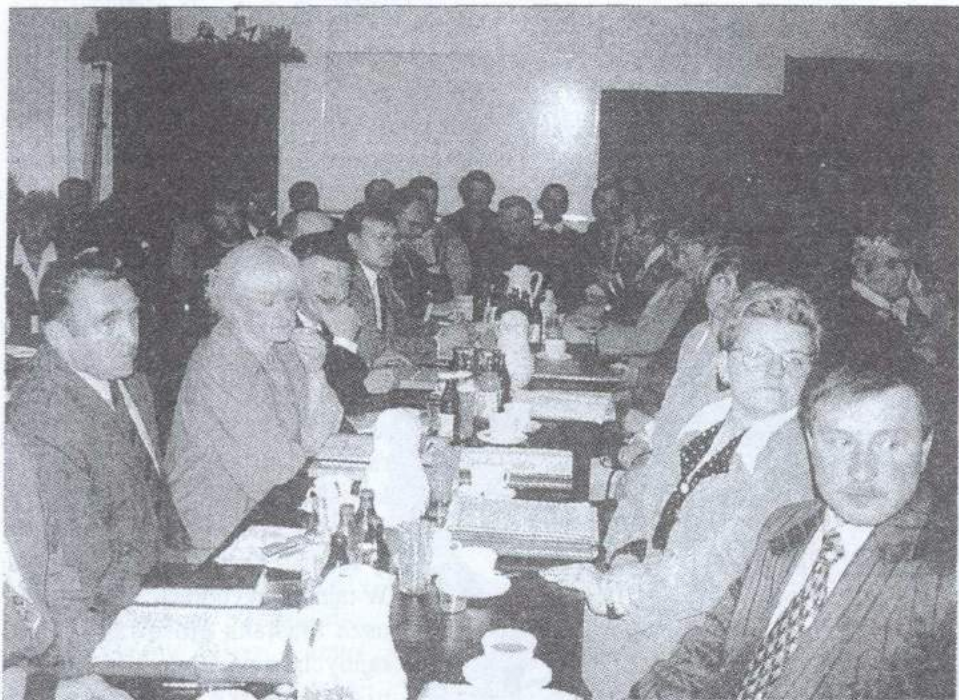
Radni na I sesji Rady Gminy Zgierz, 3 listopada 1998 r.

ROK VI, NR 14 (67) • LISTOPAD 1998 • ISSN 1425-9370