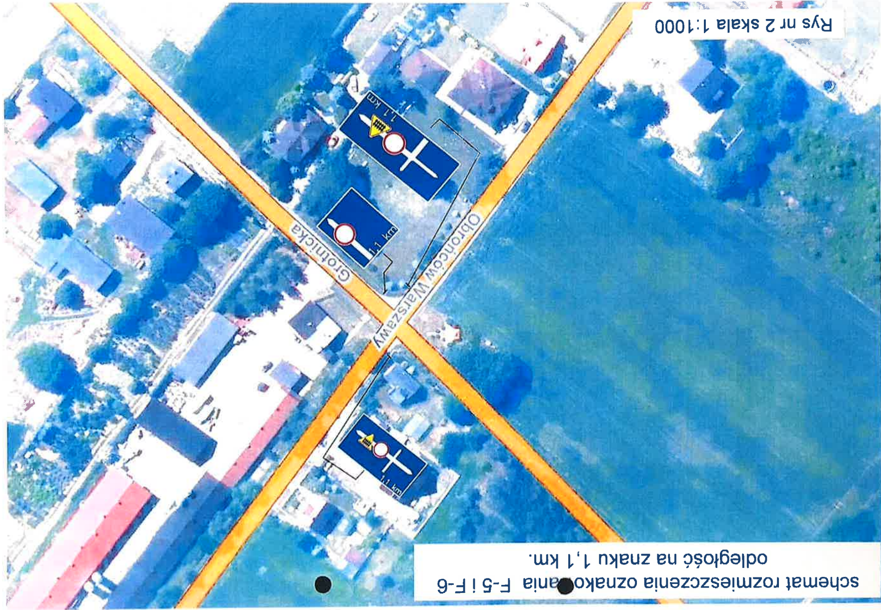
schemat rozmieszczenia oznakowania F-5 i F-6 odległość na znaku 1,1 km.