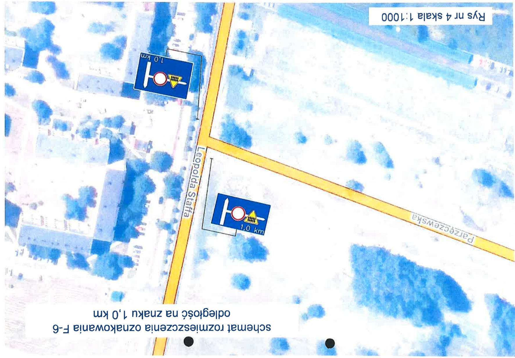
schemat rozmieszczenia oznakowania F-6 odległość na znaku 1,0 km